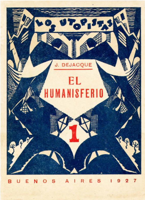
Folleto original del trabajo de Joseph Dejacque editado por "La Protesta" en 1927