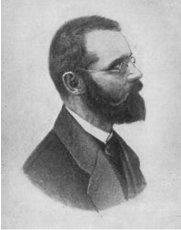
Figura 4: La Colonia Cecilia (1890)