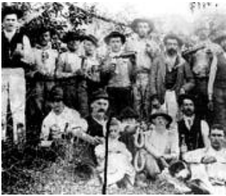
Grupo de militantes anarquistas italianos colonos en Cecilia entre 1890-1894