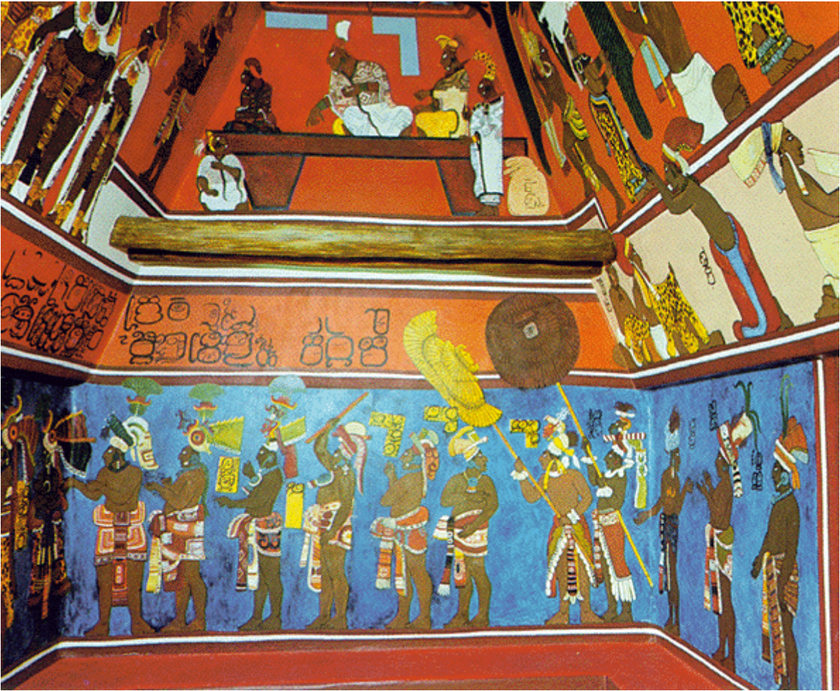
Fig. 1 Cuarto 1, muro oeste, Templo de las Pinturas, Bonampak