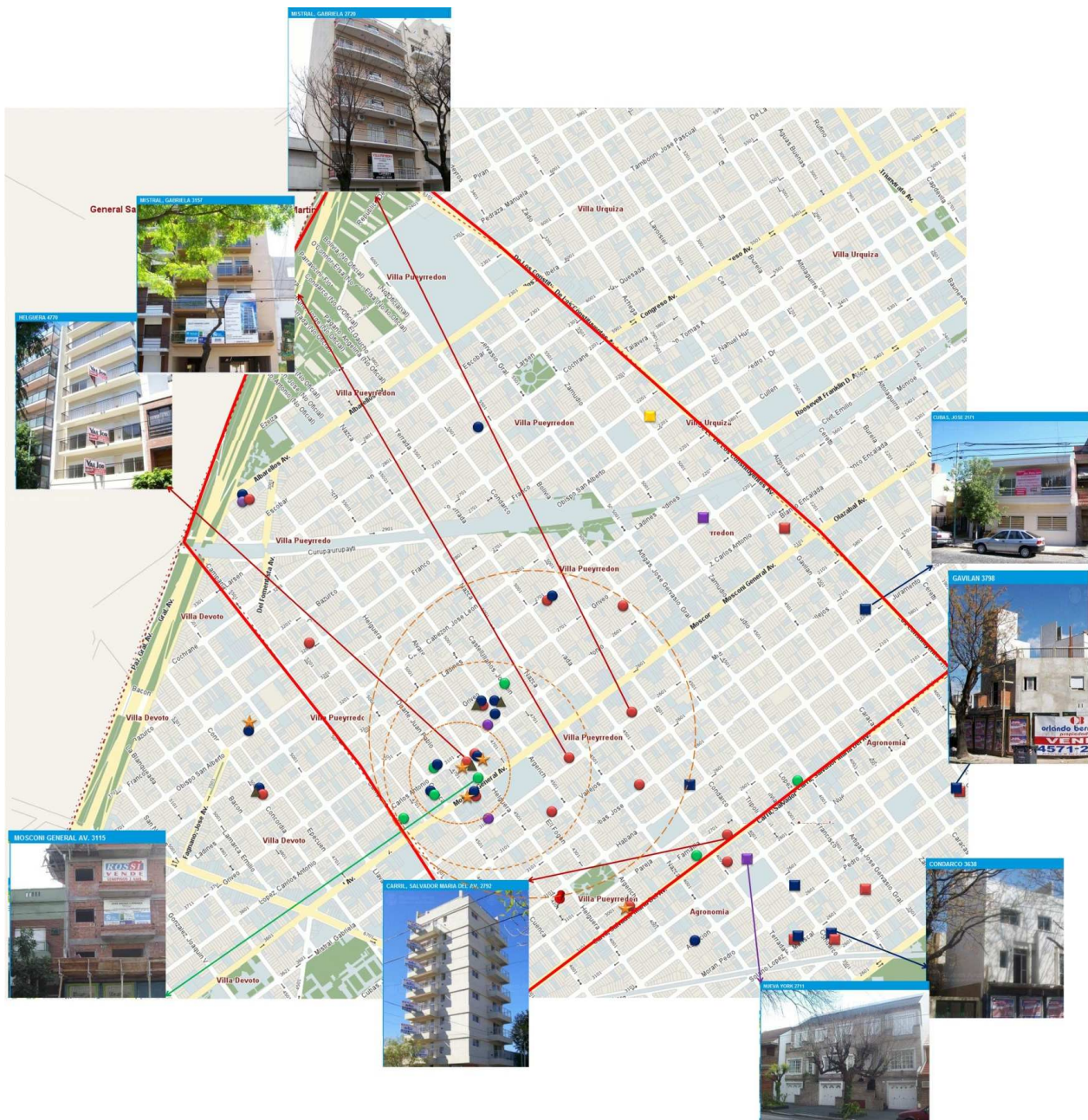
Mapa III. Oferta de departamentos en Villa Pueyrredón según cantidad de ambientes, cochera y servicios adicionales. Año 2010.

Fuente: Elaboración propia sobre Relevamiento de departamentos a estrenar en los barrios de Villa Urquiza y Villa Pueyrredón publicados los domingos en el rubro Clasificados del Diario Clarín entre el 21 de Febrero de 2010 y el 08 de Agosto del 2010.MDU. GCBA.