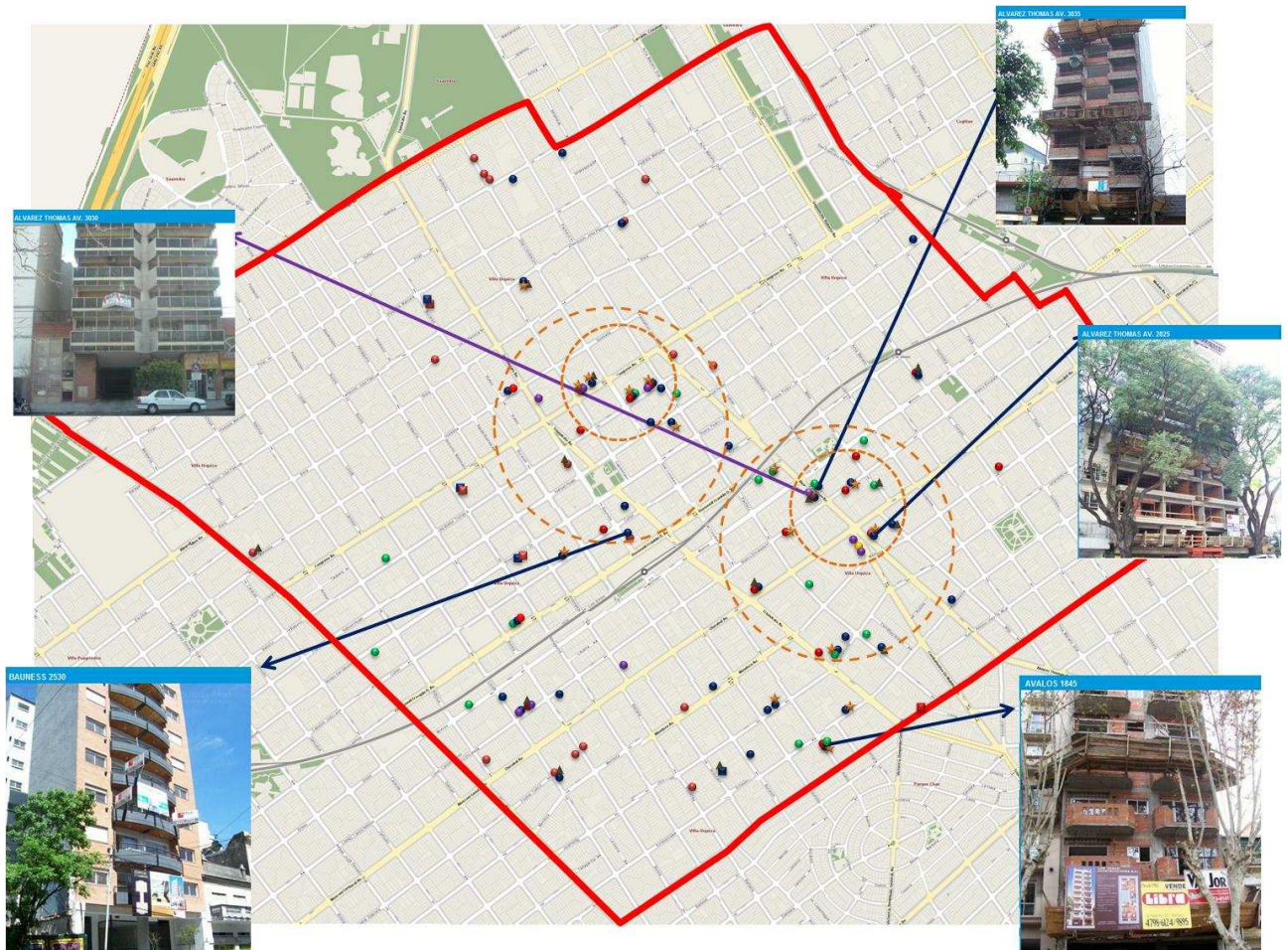
Mapa II. Oferta de departamentos en Villa Urquiza según cantidad de ambientes, cochera y servicios adicionales. Año 2010.