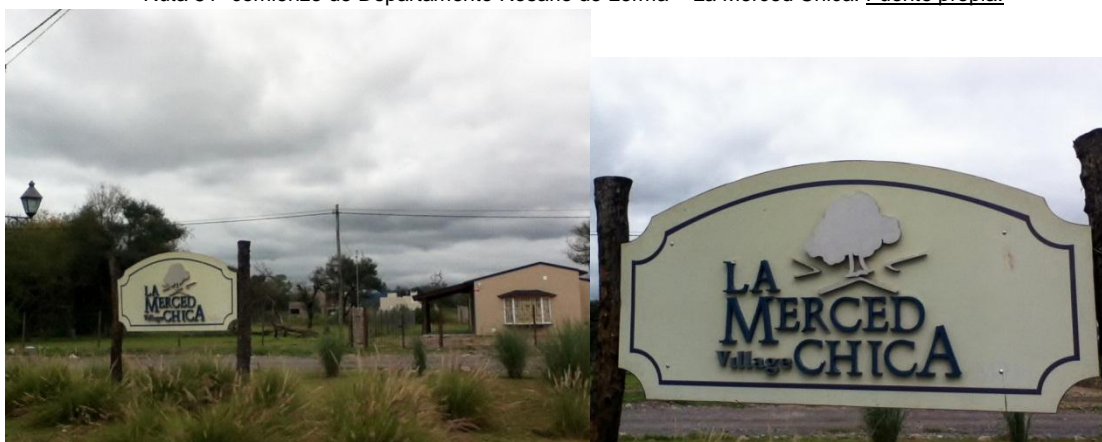
Entrada a La Merced Chica Village – sobre Ruta 51- emprendimiento MDay Loteos