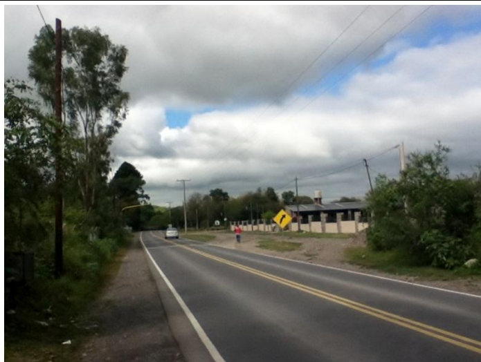
Ruta 51- comienzo de Departamento Rosario de Lerma – La Merced Chica.