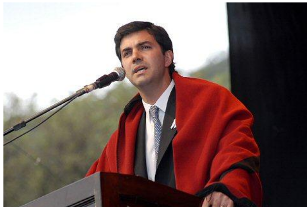
Juan Manuel Urtubey con poncho tradicional salteño, durante un acto oficial.