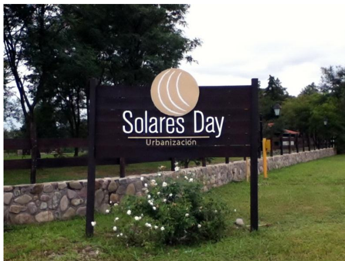
Entrada a Solares Day Urbanización – sobre Ruta 51 – MDay loteos