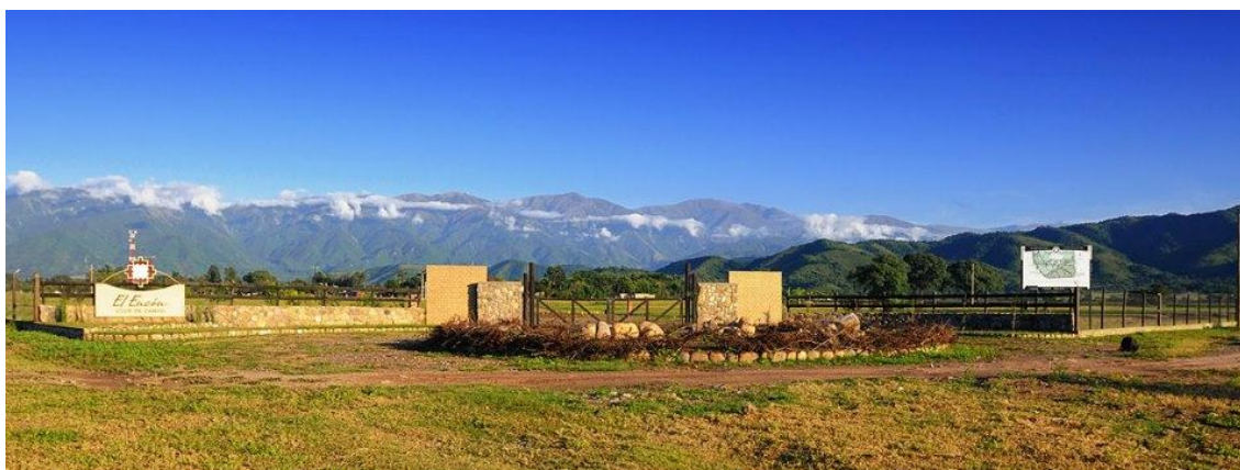
Vista panorámica del club de campo El Encón – El Encón chico