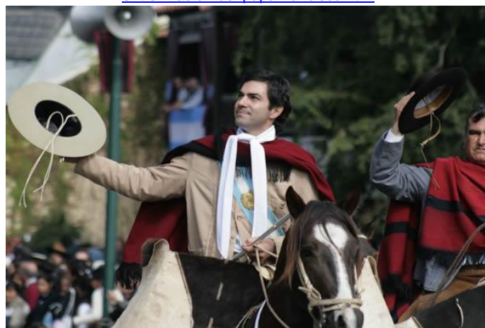
Juan Manuel Urtubey en acto oficial.