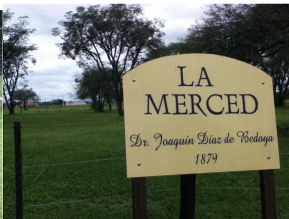
Parquización El Pacará, dentro de Solares Day Urbanización – Cartel alusivo a la historia local en entrada del viejo casco de lo que fue la Hacienda Day.