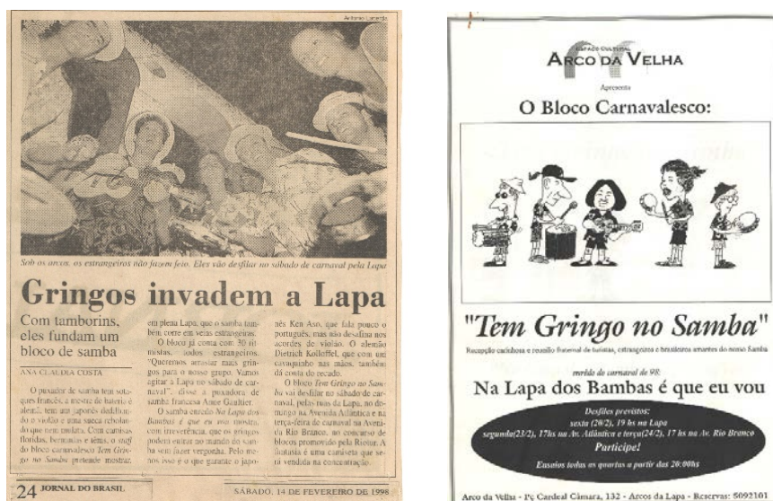
Imagem 1. Matéria e cartaz sobre o lançamento do Bloco Tem Gringo no Samba.