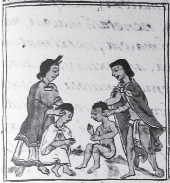
Figura 3. Estiramiento de niños. Códice florentino , t. I, libro II, cap. XVII, foj. 156r.

Finalmente, los padrinos y las madrinas conducían a los infantes a casa, en donde todos comían, bebían, cantaban y bailaban hasta el mediodía, momento en el que tendrían que regresar al templo para realizar la siguiente ceremonia. El consumo generalizado de octli comenzaba en este momento y se extendería hasta el término de las fiestas.