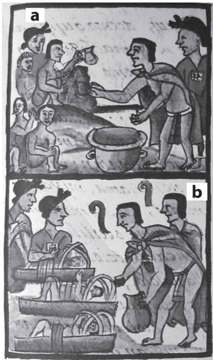
Figura 4. Borrachera de niños. Códice florentino , t. I, libro II, cap. XVII, foj. 160r.

embriagaban. Al respecto Sahagún escribió: “Y después de borrachos, riñían unos con los otros, y apuñábanse y caíanse por ese suelo de borrachos, unos sobre otros, y otros iban abrazados los unos con los otros hacia sus casas. Y esto teníanlo por bueno porque la fiesta lo demandaba así”. 66