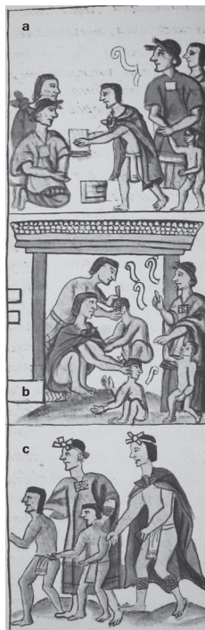
Figura 1. Rituales en la veintena de Izcalli. Códice florentino, t. I, libro II, cap. XVII, foj. 158v.