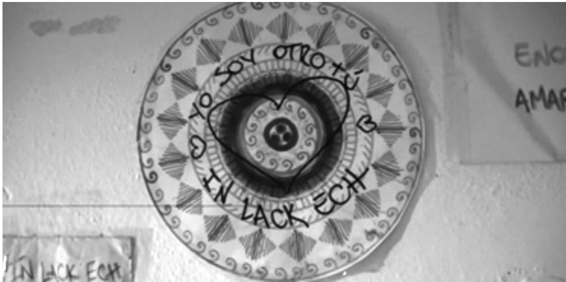
Imagen 1. Cartel del local In Lackech