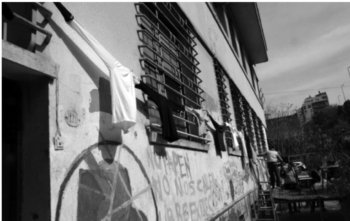
Imagen 6. Fachada del Centro Educativo Isauro Arancibia

El registro visual permite ver y oír la confluencia de dos aspectos de esta jornada: celebrar (la existencia del Centro, el edificio, la presencia de amigos y vecinos) y protestar (advertir acerca de la amenaza de derribar el edificio). Se ve una gran cantidad de estudiantes y docentes del CEIA con una pechera donde se lee “Isauro Arancibia, amor, tiza y libertad”. Estas palabras sintetizan tres funciones: contención y sostén emocional de los jóvenes (amor), enseñar y aprender (tiza) y finalmente educar para la libertad. El propósito final del Centro es que los estudiantes reflexionen y decidan sobre sus vidas. La acción político-cultural que analizamos pone el eje de la discusión en la necesidad de respeto por la dignidad de las vidas de los jóvenes, atravesados por la violencia social e institucional. Frente a la amenaza de demolición, la comunidad del Centro, los amigos y vecinos confrontan con una pasión alegre: celebran la remodelación de su edificio, de su lugar. Para concluir, presentamos las palabras que leyó una joven a través de la siguiente fotografía (imagen 7):