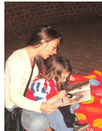
Nota.