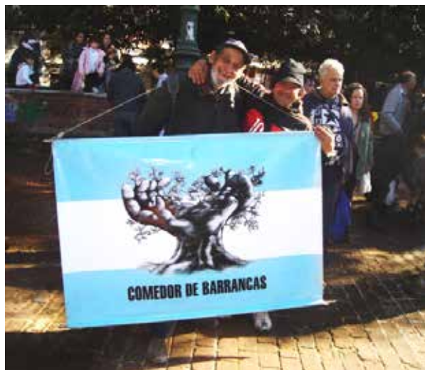
Figura 1. Bandera del Comedor El Gomero

Presentamos a continuación dos relatos analíticos diferentes de integrantes del comedor sobre la reflexión, la deliberación y la reflexión deliberada que, además, han sido trabajados también con fotografías por parte de una tercera integrante del comedor (fig. 1). A través de estos relatos queremos enfocarnos en las tres preguntas formuladas más arriba, tomando como punto de apoyo lo que elaboran los participantes de este proyecto en particular, y mostrando también algunos cambios identificados a través del tiempo por ellos mismos.