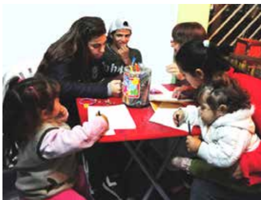
Figura 4. Apoyo escolar

Si bien antes de esa fecha existían actividades educativas, recreativas y artísticas en el comedor, que continúan existiendo, el grupo pensado para trabajar sobre aspectos educativos vinculados a la escolarización surge en 2010. Este grupo decidió autoconvocarse periódicamente y, además, no perderse el espacio de reflexión sobre sus objetivos, posibilidades, problemas recurrentes y organización de actividades (fig. 5). Esta posibilidad se produjo en 2011 en forma sistemática porque la ofrecieron los voluntarios de INCLUIR para acompañar nuestro proceso. A través de observar nuestra práctica concreta por medio de nuestras reflexiones, fotografías y registros escritos, pudimos cuestionarnos sobre nuestro quehacer.