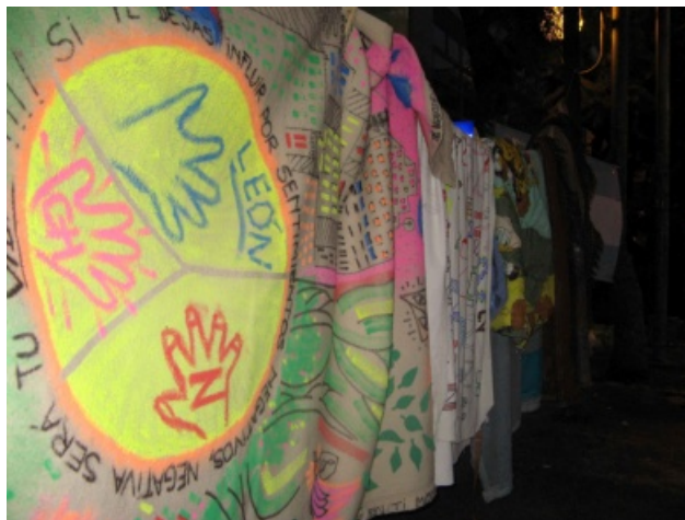
Figura 3. Confección de frazadas para los asistentes al comedor