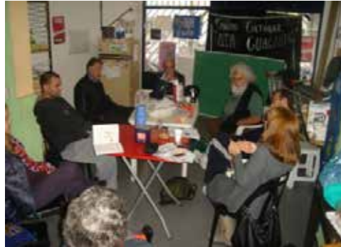
Figura 5. Reuniones de trabajo

Nos posicionamos así en que el trabajo apunta más a desarrollar el espíritu crítico y conocer diferentes técnicas de expresión para los niños o jóvenes que concurren al apoyo y así probablemente encontrarnos con el deseo de ellos. Empezamos entonces con una reflexión sobre la tarea concreta, más cercana a una evaluación de lo propuesto y lo logrado, y a revisar la orientación sobre la que se fundó este espacio de trabajo. Llegamos así a pensarnos en el marco de la educación popular. A través de este primer posicionamiento, y en diálogo con otra organización, se consiguió material para alfabetización de adultos. Allí se produjo otro nuevo reposicionamiento, ya que los voluntarios del apoyo escolar aprendimos que existe un enfoque educativo que se concentra no solo en alfabetizar sino en pensar que la alfabetización podría permitir reflexionar críticamente sobre la realidad. Estos cambios de posicionamiento ocurrieron en encuentros concretos en los que se producían grietas (en el pensamiento de los voluntarios del comedor) a partir de contrastar nuestras propias ideas con las de otros (de INCLUIR en este caso) o con nuestras propias ideas según quedaban registradas y podíamos revisitarlas.