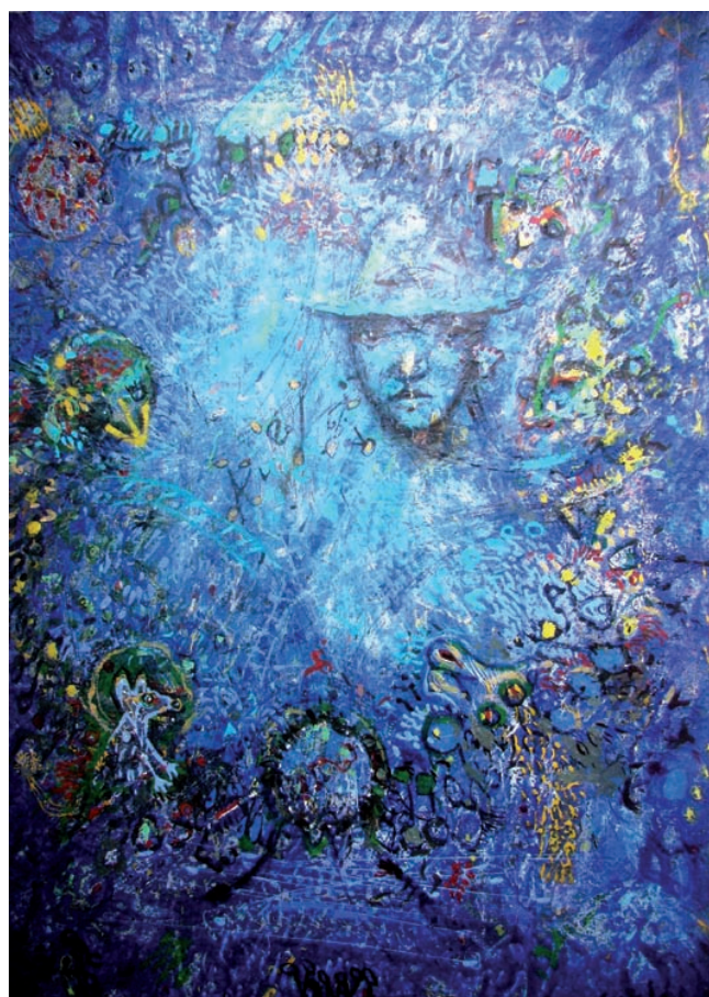
EN EL CUBILCHE Acrílico y óleo sobre lienzo (2003) 0,80 x 0,60m

El lenguaje verbal usado en el sector profesional, señalando a los informadores, destaca un lenguaje periodístico cargado de coloquialismos, usado en su mayor parte por el informador central, la presentadora, haciendo uso de palabras y expresiones para la narración e introducción de la noticia que consigan ser más cercana para los espectadores. Asimismo, usan un lenguaje periodístico utilizando la regla de las «3C»: claro, correcto y conciso, aportando la información deseada por los telespectadores y ofreciéndose las de una manera sencilla para la creación de la opinión pública. Este tipo de lenguaje se puede