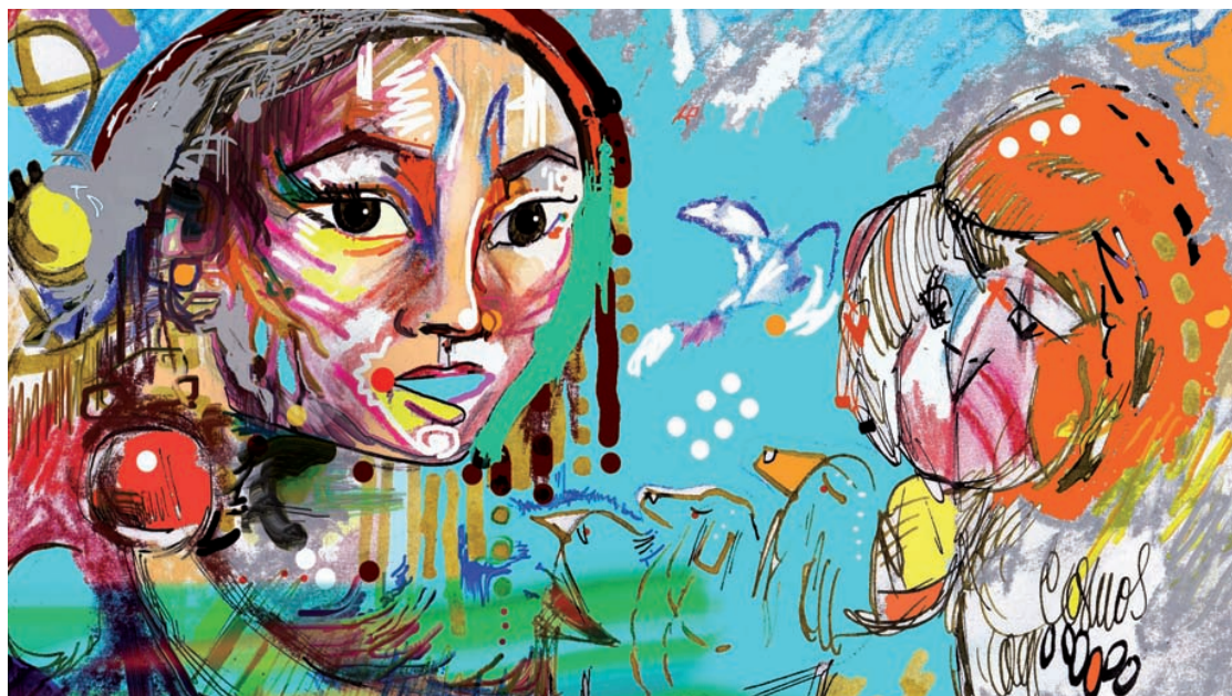
KOSMUNISMO I Lápices de color acuarelables y arte digital 0,20 x 0,45m

cativas que generen estrategias para fomentar una audiencia más cualificada y que exija una televisión de más calidad. Estas conclusiones son la justificación de por qué esta línea de formación de las audiencias, en detección de tópicos y estereotipos, el control de las emociones y sentimientos sean clave para el desarrollo social. Es necesario, hacer hincapié en la necesidad de establecer una recepción crítica en los mensajes que se transmiten. La alfabetización audiovisual es una condición importante de nuestro estudio, pues se trata de aprender y aprovechar las potencialidades del medio audiovisual. El presente estudio es el primer esbozo de una extensa investigación de los programas de «corazón» y por lo tanto, nuestras futuras líneas de investigación se desarrollarán bajo la necesidad de plantear propuestas formativas para desplegar una mejor alfabetización mediática relacionada con la programación televisiva de calidad, apostando por el lenguaje, los estereotipos y los programas sensacionalistas en la televisión pública, así como fomentar el hábito de los espectadores en un consumo inteligente con el objetivo de conseguir que estos puedan interpretar, por sí mismos, los mensajes televisivos, así como realizar un análisis crítico de los contenidos y mensajes, a pesar de que existen pocos estudios o investigaciones que refuten esta investigación.