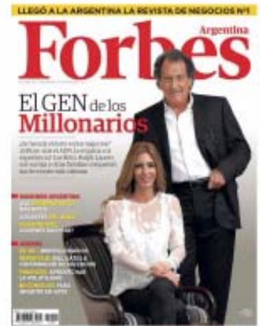
Figura 6. La figura nos muestra la Portada de la revista Forbes , publicada en Argentina en el año 2011.

En esta ocasión los alumnos no escribieron sus cartas, sino que luego de un encendido debate escribieron individualmente cartas (Figura 7). En estos casos pudimos observar que los estudiantes consiguen usar la definición de gen aprendida durante la secuencia para refutar la noción que aparece en la tapa. Por otra parte, identificaron ajustadamente el destinatario, ya que se dirigen al editor y a la autora del artículo. Sin embargo, al mencionar los aspectos culturales, sociales y económicos, observamos que les faltaban argumentos para aplicarlo al caso puntual. ¡Claro!, a esto lo trabajamos poco en clase.