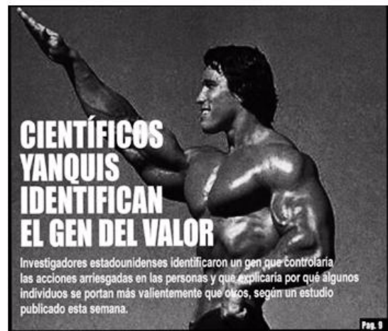
Figura 8. «Científicos yanquis identifican el gen del valor». Noticia real publicada por «El Determinista» con cierta ironía en el blog http://www.quevivaaldiversidad.blogspot.com/