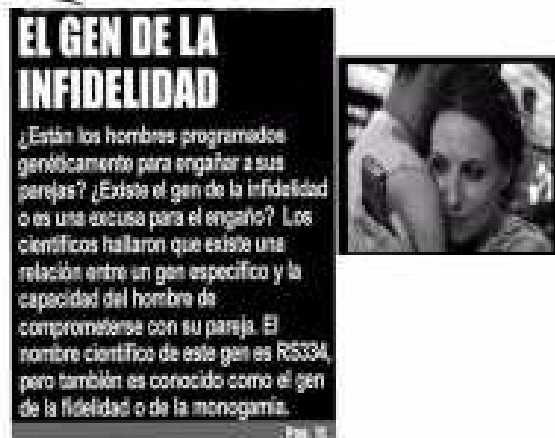
Figura 9. «El gen de la infidelidad». Noticia real publicada por «El Determinista» con cierta ironía en el blog: http://www.quevivaaldiversidad.blogspot.com/