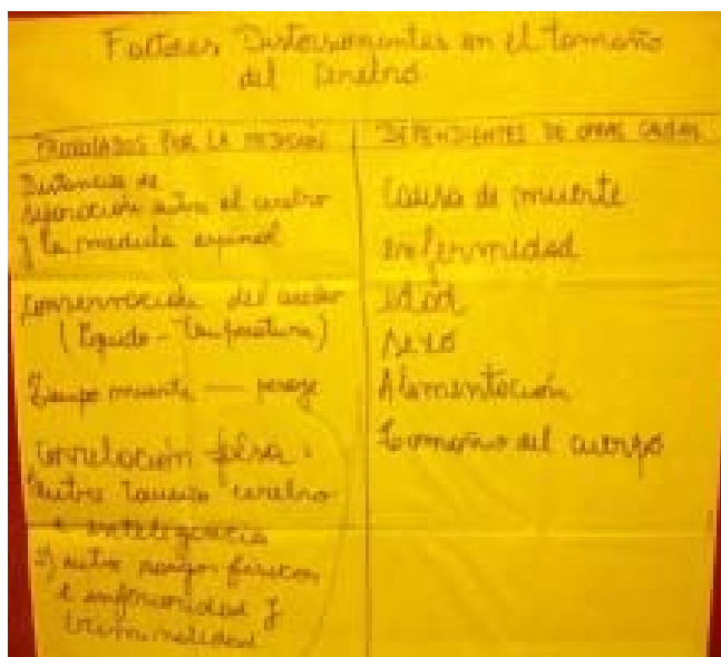
Figura 1. Fotografía del Afiche en el cual se registran los argumentos de los estudiantes en contra de mediciones de deterministas de la Craneometría a partir de las ideas rescatadas del texto de Stephen Jay Gould. Estos fueron piezas claves en la reescritura de las cartas.

consecutiva la lectura de un texto correspondiente al libro del paleontólogo Stephen Jay Gould «La falsa medida del hombre», destacando en un afiche (Figura 1) los argumentos en contra de las mediciones de deterministas de la Craneometría. De este modo les «prestaríamos» otras ideas de las cuales vale la pena para reescribir sus cartas.