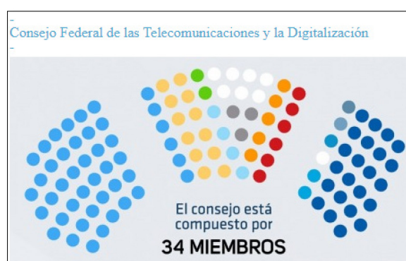
Figura 4. Conformación del Consejo Federal de las Telecomunicaciones y la Digitalización.

En ese sentido, el artículo 85 crea al Consejo Federal de Tecnologías de las Telecomunicaciones y la Digitalización y le atribuye como “misiones y funciones” – además de la cuestiones relativas al aparato burocrático- “colaborar y asesorar en el diseño de la política pública de telecomunicaciones y tecnologías digitales”, pautar los concursos y licitaciones, elaborar informes del sector, proponer medidas a la autoridad de aplicación y “monitorear el avance de los indicadores y estándares del servicio universal, de los servicios públicos establecidos así por la presente y de la velocidad de transmisión”.