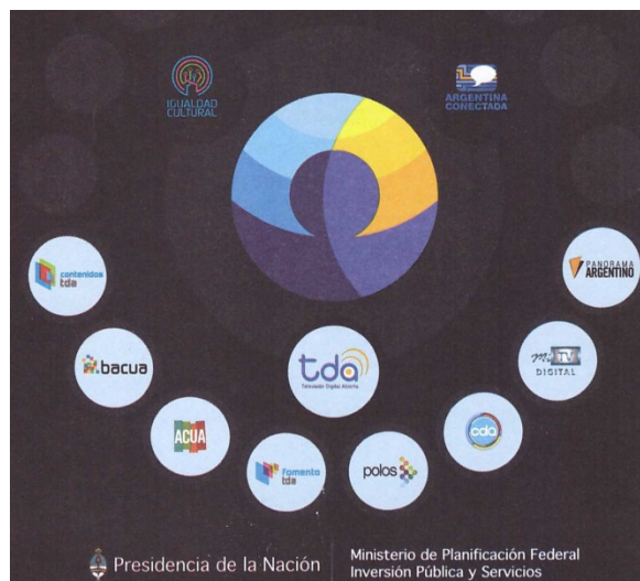
Figura 2: Políticas del MINPLAN

Las políticas incluidas en este ítem surgieron al interior del programa Argentina Conectada (Figura 2), por lo que sus articulaciones están explícitas en los documentos relevados al reunir los múltiples objetivos que persiguen.