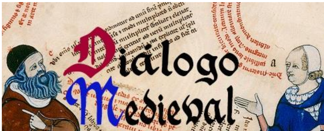
Imagen 3. Diálogo Medieval. http://dialogo.linhd.es/ .

Se trata de la primera fase del proyecto para el estudio, edición y etiquetado de la poesía castellana medieval dialogada (siglos XII-XV):