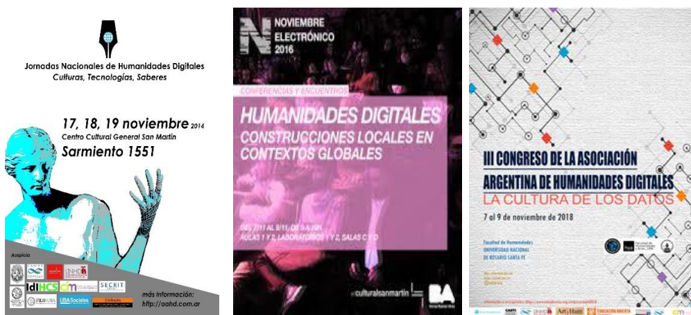
Pósters de los tres congresos de la Asociación Argentina de Humanidades Digitales (AAHD), 2014-2016-2018.

La cultura de los datos fue el eje que guió las presentaciones y debates del tercer congreso internacional de la Asociación Argentina de Humanidades Digitales (AAHD), que organizamos en la Universidad Nacional de Rosario en el año 2018 2 . El título tiene algo de orgánico y fue gestándose desde los plurales de las primeras jornadas del año 2014 -Tecnologías, Culturas, Saberes 3 - y desde las construcciones y contextos que cruzan lo local y lo global en nuestro campo, tema que nos convocó en 2018, apropiándonos de conversaciones de las Global Digital Humanities 4 .