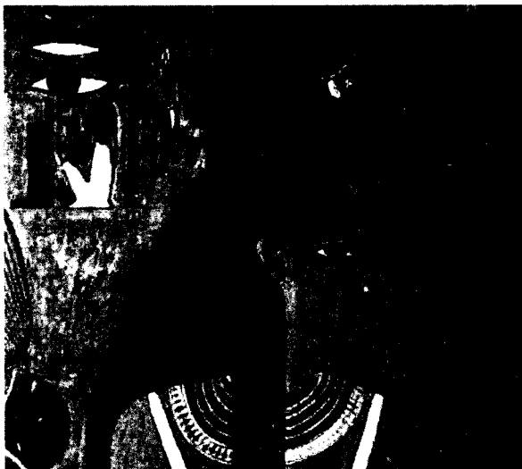
Figura 1. Isis con el trono. Tumba de Nefertari. XIX dinastía.

Si existe una divinidad femenina que llegó a gozar de la más alta consideración y popularidad dentro de la historia egipcia desde los momentos más tempranos hasta el período grecorromano, e incluso influyó en la religión cristiana, ésta no fue otra que Isis.