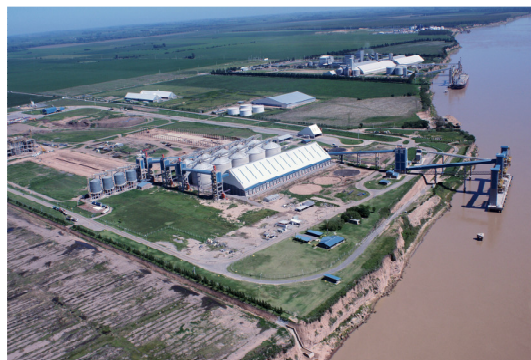
Figura 2: Fotografía aérea tomada en febrero de 2009.