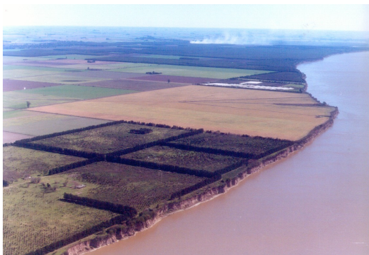
Figura 1: Fotografía aérea de la costa de la Comuna tomada en diciembre de 2006, previo a la construcción de las plantas.

Otra de las transformaciones relevantes tiene que ver con el paisaje de la costa de la localidad. En las siguientes imágenes puede percibirse cómo en un período de sólo 3 años cambia por completo la fisonomía de este espacio geográfico.