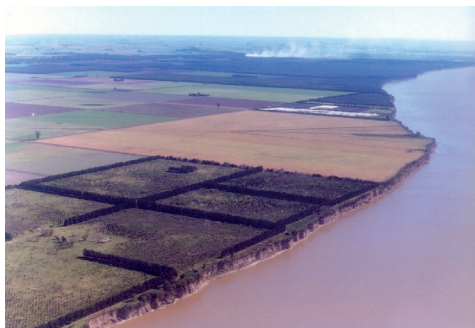
Fotografía aérea de la costa de la localidad tomada en diciembre de 2006, previamente a la construcción de las plantas.