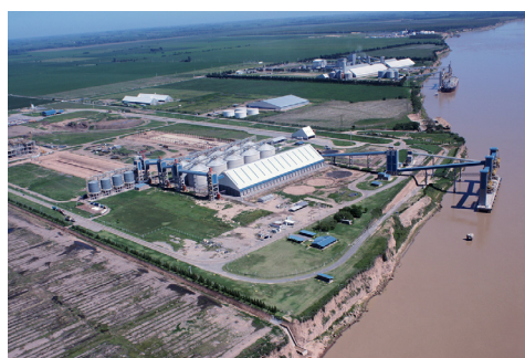
Fotografía aérea de la costa de la localidad tomada en febrero de 2009.

En este contexto, la investigación se propuso como objetivo principal generar conocimiento sobre la diversidad de sentidos en torno a la tecnología en cuatro espacios analíticos diferentes de esta localidad: las empresas recientemente instaladas, el Gobierno local, los ámbitos educativos de la localidad y trabajadores que ejercen o ejercieron oficios tradicionales (por ejemplo, carpintería, herrería, costura, entre otros).