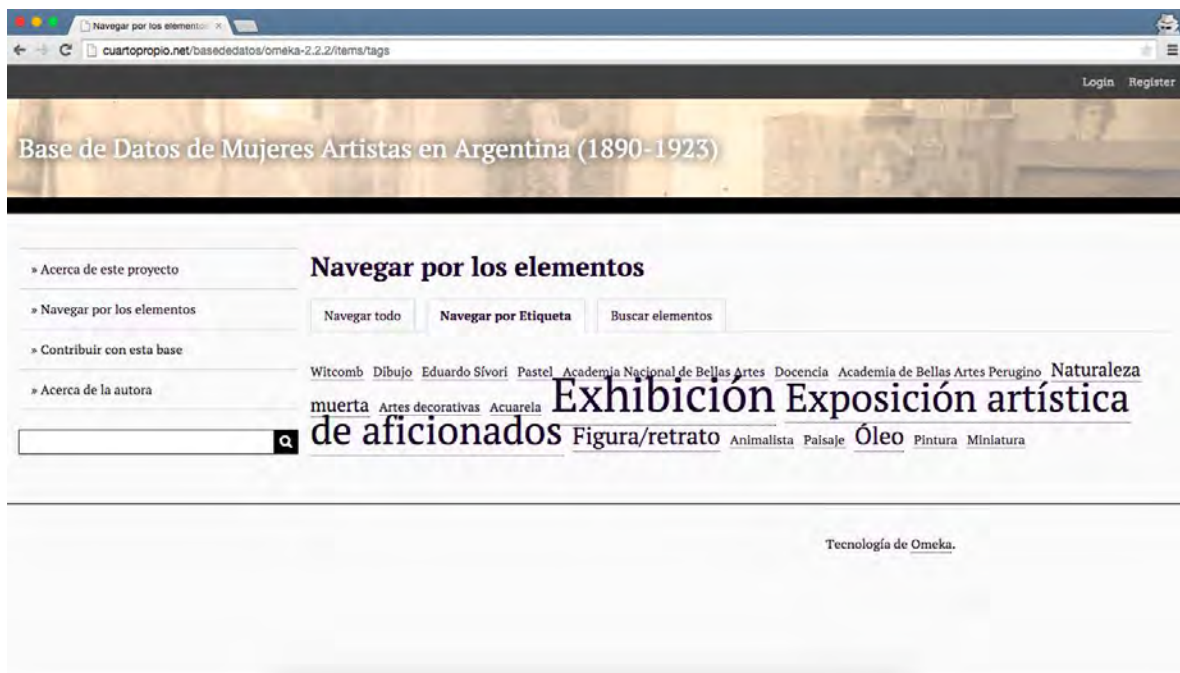
Imagen 2. Captura de pantalla de la versión actual de la Base de Datos de Mujeres Artistas en Argentina (1890-1923).

Adicionalmente, resulta fundamental poder agregar una serie de “etiquetas” para permitir navegar el sitio y agrupar las artistas por factores comunes. De este modo, sería posible recuperar rápidamente las artistas participantes del Salón Nacional o las estudiantes de la Academia Parisi: