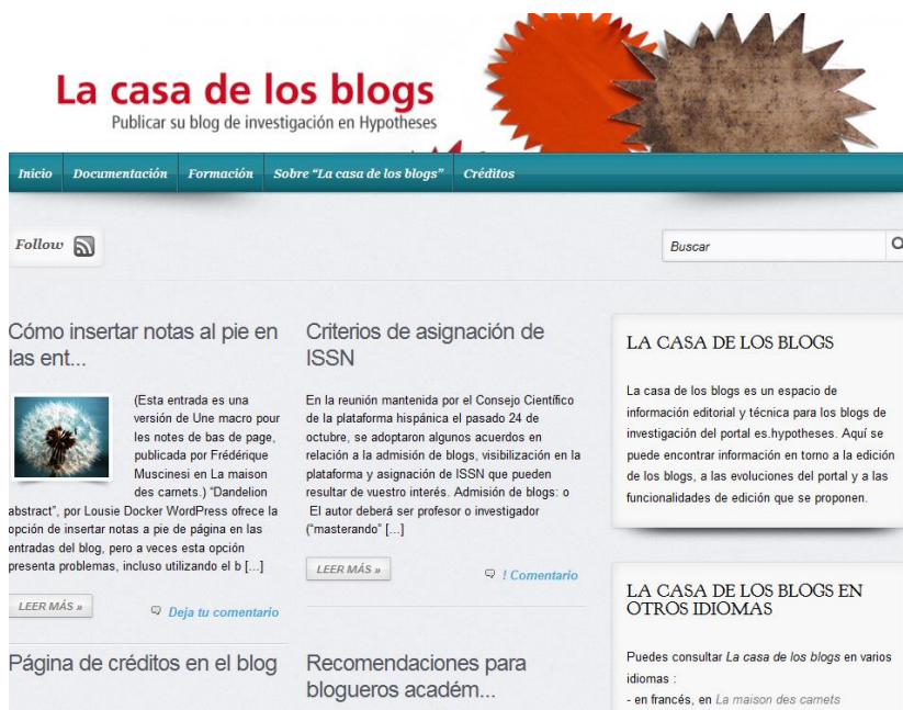
Imagen 2. La casa de los blogs.

En cuanto a las mejores posibilidades de edición que los docentes e investigadores encuentran en su blog en Hypothèses , cabe destacar que cuando los técnicos creamos su blog dentro de la plataforma de blogging académico, directamente cuentan con tres páginas: la principal donde podrán leerse sus entradas; una segunda página llamada Sobre el blog en el que se incluye información sobre el proyecto editorial que se va a desarrollar; y una tercera Créditos en la que aparecen todas las personas que colaboren en el blog, indicando su contribución al mismo. Ambas páginas podrán editarse por el autor/es tantas veces como lo desee. Teniendo en cuenta la importancia de estas páginas en un blog académico, puede considerarse una ventaja el disponer directamente de ellas.