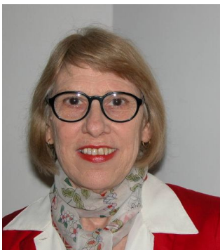
CV de la Autora