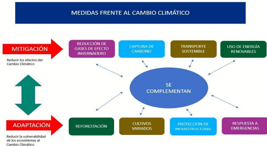
Gráfico 2: Medidas frente al Cambio Climático.

En este marco, las empresas pueden decidir realizar medidas de adaptación, mitigación y comunicación. Esas medidas implementadas y reveladas en los reportes de sustentabilidad serán el objeto de nuestro análisis.