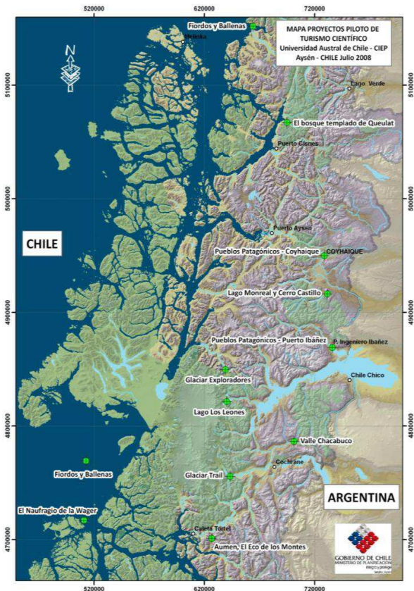
Figura 1. Mapa de la Región.

Pero Aisén es ante nada un mundo enorme y extraordinariamente diverso. Así como los primeros estudios sobre los eventos volcánicos en Patagonia suponían una sincronía de las erupciones en Bariloche y en Tierra del Fuego y proponían cuatro ciclos eruptivos para caracterizar a todo este enorme espacio (Auer 1974) y hoy no sólo sabemos que cada volcán tuvo sus propias erupciones independientes, sino que geológicamente los volcanes de esta zona corresponden a dos sistemas totalmente diferentes 36 (Stern 2004). Así como los primeros perfiles polínicos o los primeros estudios paleoambientales multi-proxy de columnas sedimentarias se generalizaron acríticamente a todo Patagonia (ej. Heusser 1961) y hoy sabemos que no sólo hay grandes diferencias entre el oriente de los Andes y la costa del Pacífico, sino que valles andinos relativamente cercanos pueden presentar distintas trayectorias históricas. Así como los estudios arqueológicos en Aisén suelen basarse en