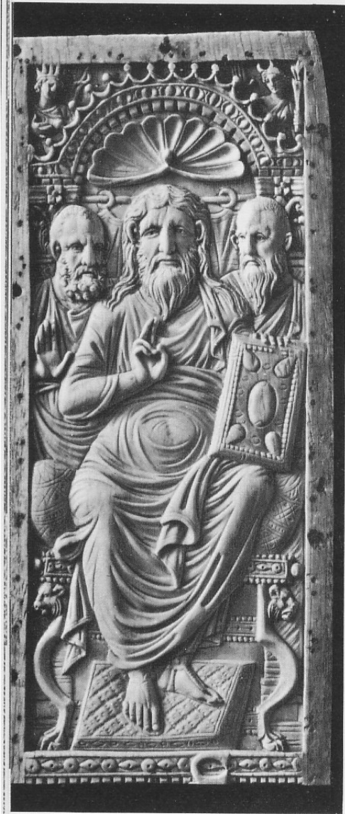
Díptico. Cristo entre Pedro y Pablo. Museo Nacional de Berlín.