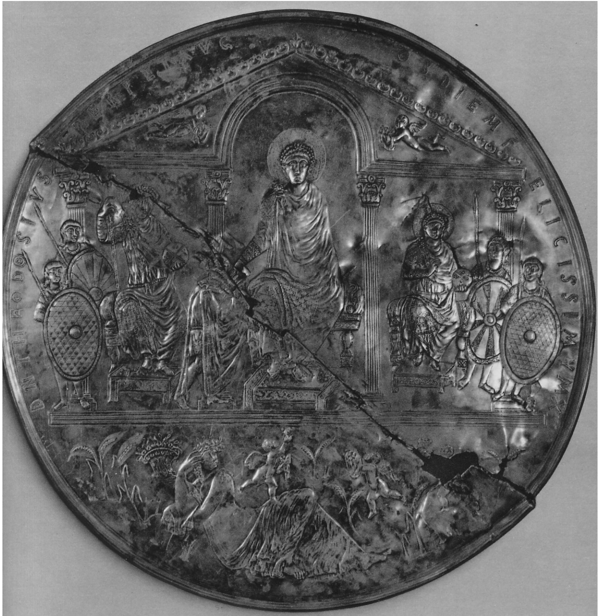
Misorio de Teodosio I. Real Academis de la Historia. Madrid.