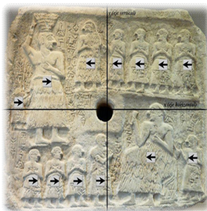
Fig. N° 4.

Otro aspecto que podemos notar es el tamaño significativo que adopta Ur-Nanše tanto en el plano S como en el I . En efecto, la efigie real predomina sobre las demás, su jerarquía se encuentra enormemente distinguida. Incluso, el texto alude al gobernante en calidad de “lugal”, es decir “gran hombre”, lo que nosotros anacrónicamente traducimos por “rey”.