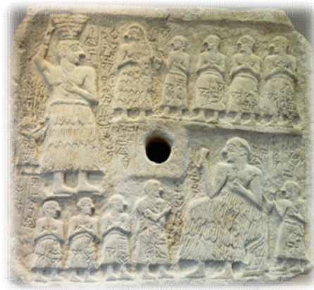
Fig. N° 1. 4

La placa se divide en dos planos ( S e I ) (ver fig. N°2 y N°3), y en el primero ( S ) podemos leer: 1) Ur- d Nanše 2) lugal Lagaš 3) dumu Gu-NI-DU 4) dumu Gur-sar 5) e 2 d Nin-gir 2 -su 6) mu-du 3 7) e 2 d Nanše 8) mu-du 3 9) Abzu-ban 3 -da mu-du 3 . De esto traducimos: “ Ur-Nanše, rey de Lagaš, hijo de Gunidu, el hijo de Gursar, el templo de Ningirsu, en el nombre de éste edificó, el templo de Nanše, en el nombre de ésta edificó, el pequeño Abzu, en el nombre de éste edificó ”. Mientras en el otro plano ( I ), podemos apreciar las siguientes líneas: 1) Ur- d Nanše 2) lugal 3) Lagaš 4) ma 2 -Dilmun (a) 5) kur-sag 6) gu 2 -giš 7) mu-gal 2 . La transcripción del mismo arroja, a grandes rasgos, el siguiente mensaje: “ Ur-Nanše, rey de Lagaš: los barcos de Dilmún, desde este país lejano, transportaron la madera en su nombre [es decir, para Ur Nanše] ” 5 .