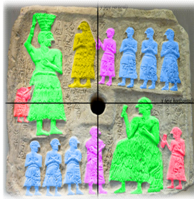
Fig. N° 5.

Respecto del aspecto del monarca, es substancial destacar que su vestido es diferente al del resto de los personajes y posee, además un mayor tratamiento, tanto en el plano S como en el I . Por otro lado, se lo ve rasurado y sin barba, acorde a las costumbres súmeras y semejante a los coperos (pintados de rojo) y los nobles (hijos de la pareja real) (coloreados de azul). Estos últimos, tienen las manos entrelazadas, adoptando la inconfundible postura de devoción, similar a la de muchas de las estatuillas denominadas suplicantes, que también pertenecen al Dinástico Antiguo y fueron descubiertas en Tell-Asmar 19 . Los hijos, están en “actitud de rezo”, caracterizados como orantes, pero, ¿ante quién? No podemos afirmar con certeza que sea ante Ur-Nanše, pero sí proponerlo como una hipótesis tentativa. Además, tanto los tres nobles de B , como los de C , están distribuidos proporcionalmente en relación al orificio central, en simetría “oblicua”.