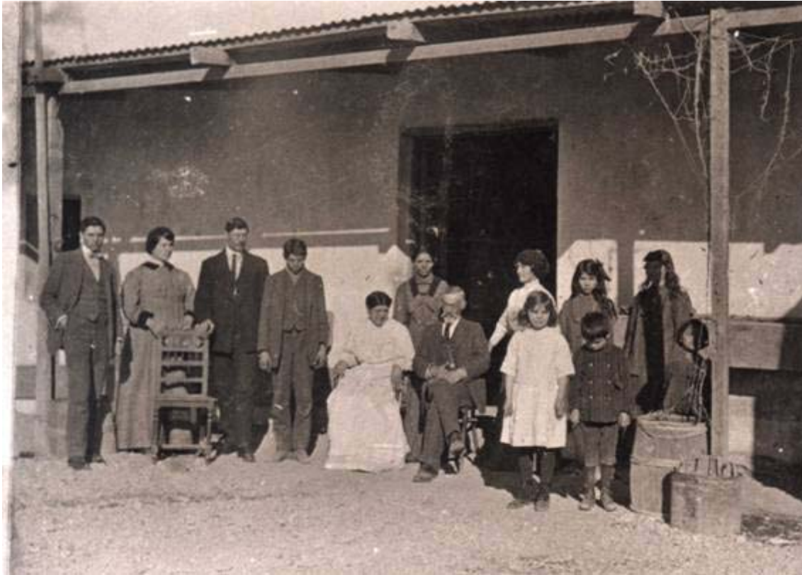
Foto 5. Familia Nordestrom; la mujer sentada en el centro de la fotografía es la mayor en edad; todas las otras mujeres se encuentran paradas por detrás, reconociendo la autoridad. Una silla vacía indica una ausencia. Era muy común en la época indicar la pérdida de un ser querido para la familia; las faldas largas de las mujeres ocultan las figuras mientras que las niñas llevan vestidos con faldas mas cortas, al igual que los pantalones en los hombres. En la indumentaria se corporizan distinciones y pertenencias.

Los personajes fotografiados se han vestido con sus ropas más decentes, como era de rigor cuando la gente era visitada por el fotógrafo para hacer un retrato.