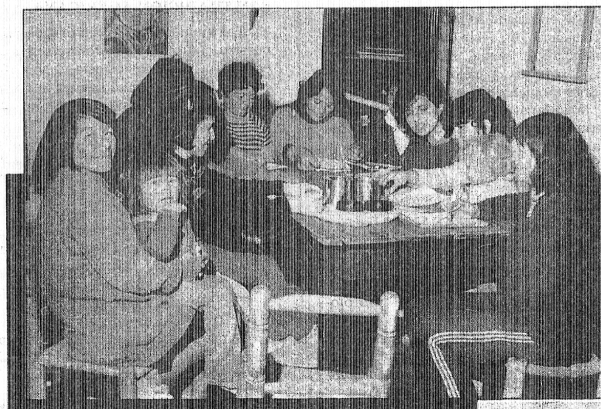
Encuentro de las Chicas con mujeres en el barrio Belgrano. Lujan.