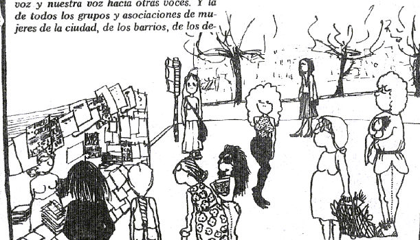
Portada del primer número del Diario de las Chicas . Marzo-1987

LEANOS, ESCRIBANOS, NO SE OLVIDE Ud. también es UNA CHICA