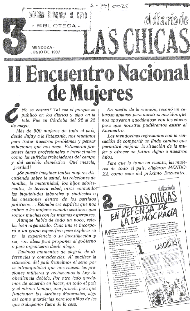
Portada del tercer número del Diario de las chicas. Junio-1987

Al igual que todo movimiento social revolucionario, el feminismo cae en la trampa de petrificarse conseguidas sus primeras reivindicaciones y conseguida la posibilidad de legitimidad social. El proyecto revolucionario se convierte de ahí en adelante en rutina burocrática de ministerios y congresos, como si ésta bastara para colmar toda expectativa política, como si las formas de quehacer político se agotaran en torno a reformas en el aparato estatal nacional o transnacional (2007.p 14)