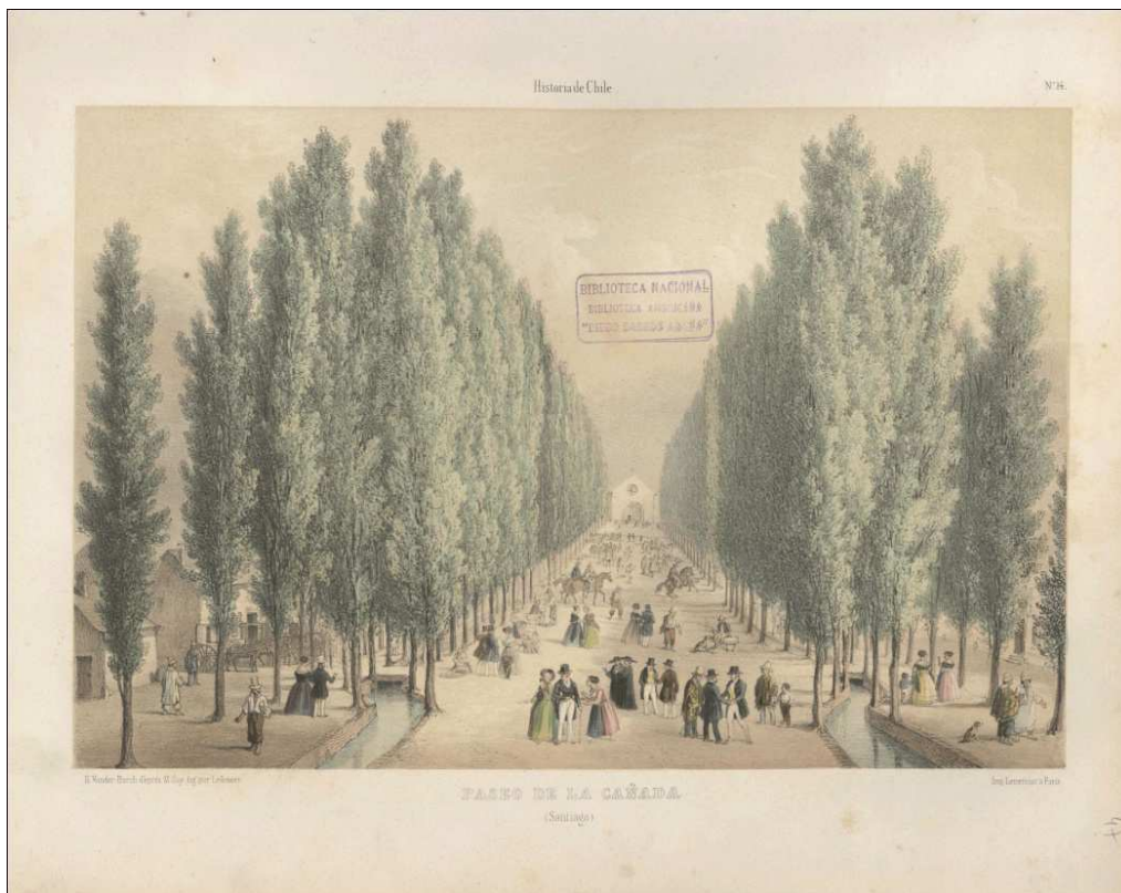
Fig.5: Claudio Gay, Paseo de La Cañada (Santiago) , 1854.

Fuente: Gay, Claudio (1854), Atlas de la Historia Física y Política de Chile , París: Impr. De E. Thunot.