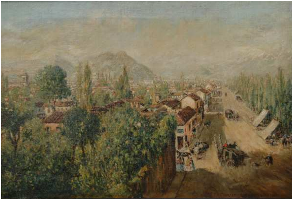
Fig.9: Ernest Charton de Treville, La Cañada de Santiago , 1863. Museo Nacional de Bellas Artes (Chile)