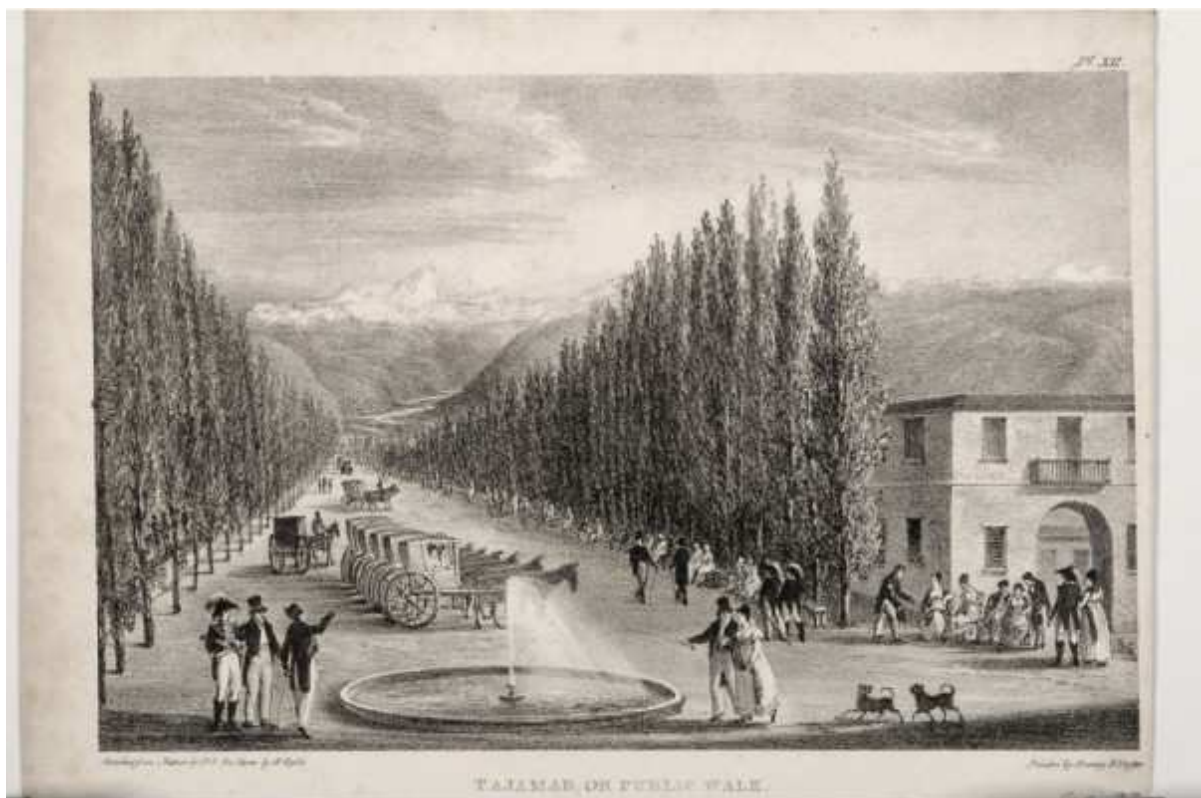
Fig.2: Peter Schmidt, Tajamar or public walk , 1824. Museo Histórico Nacional (Chile).