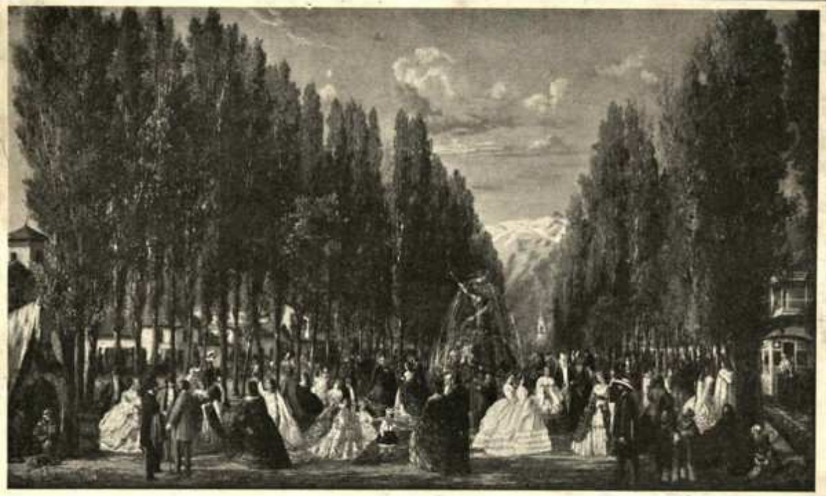
Fig.7: J. Charton, Alameda, Santiago , 1850. Museo Histórico Nacional (Chile)