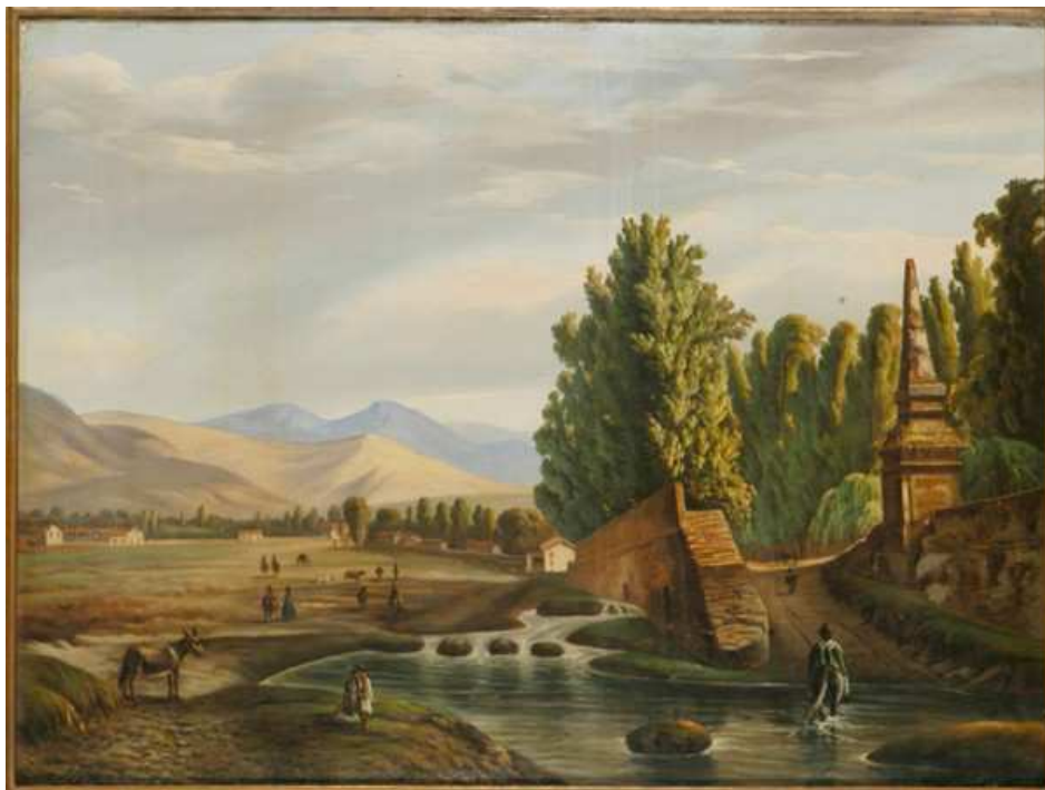
Fig.3: Giovatto Molinelli, Vista de los Tajamares del Mapocho , c. 1855. Museo Histórico Nacional (Chile)