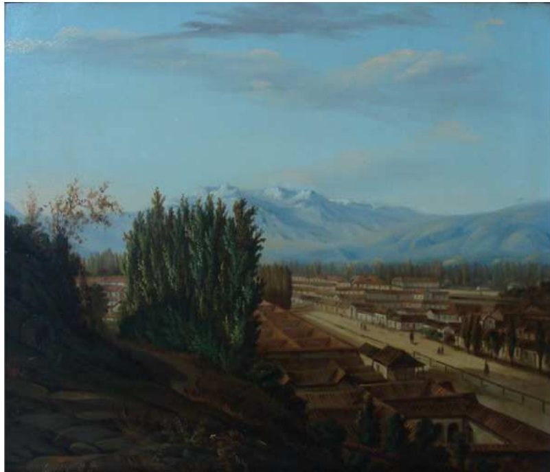
Fig.8: Givatto Molinelli, Antigua Cañada de Santiago , 1861. Museo Nacional de Bellas Artes (Chile)