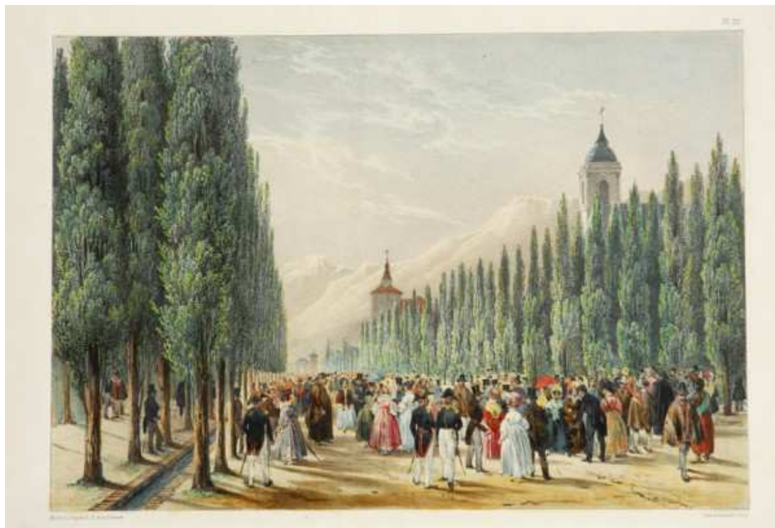
Fig.6: Edmond Bigot de la Touanne, La cañada promenade publique de Santiago , 1828. Museo Histórico Nacional (Chile)