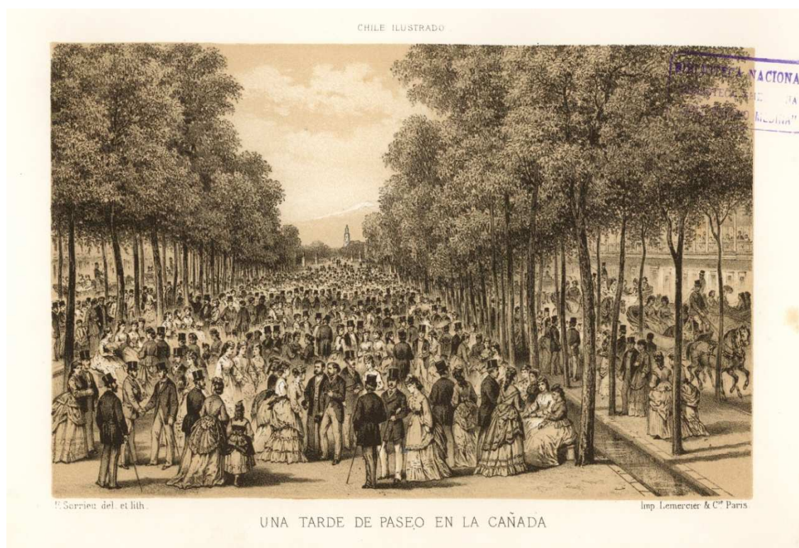
Fig.4: Frédéric Sorrieu, Una tarde de paseo en La Cañada , 1872.

Fuente: Tornero, Recaredo (1872), Chile Ilustrado: guía descriptiva del territorio de Chile, de las capitales de Provincia, de los puertos principales , Valparaíso: Librerías i Agencias del Mercurio.