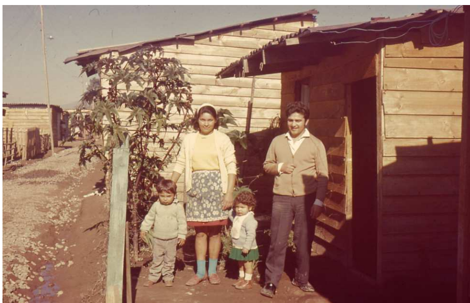
Nueva La Habana (1972).

A inicios de 1970 el movimiento de pobladores adquiere un nuevo giro producto de la toma “26 de Enero” comandada por el MIR. A partir de ese momento se inaugura una serie de tomas de terreno propugnadas o dirigidas por el Movimiento de Izquierda Revolucionaria bajo su estratégica concepción del “frente de masas”: la unión de trabajadores, campesinos y pobladores en función de la lucha clasista contra la burguesía.