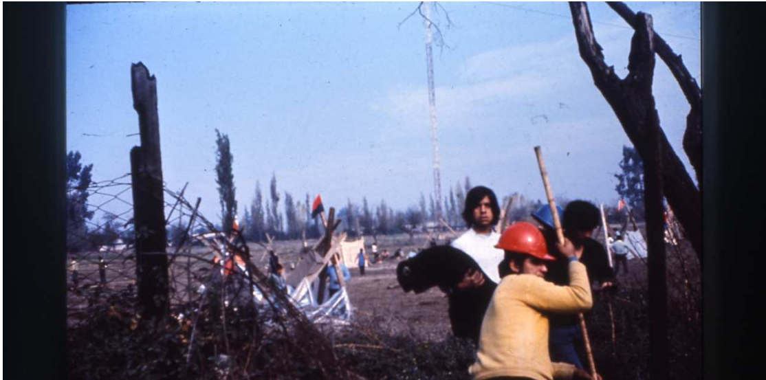
Nueva La Habana (1972).