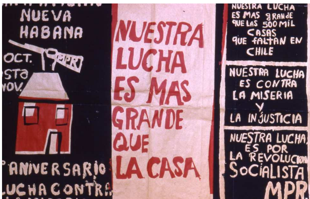
Nueva La Habana (1972).

Para ello, la convivencia tenía que ser intervenida, era portadora de un fin estratégico. Sin embargo, no se puede desconocer que en la implementación de las penas existe el criterio de reincidencia, del juicio justo y comunitario, la protección de la familia e inclusive que la misma sanción era asistida por la comunidad. Son rasgos que nos dan atisbos de un horizonte que es mucho más profundo y anhelante, de autoformación de sociedad. Quizá en los mismos pobladores no existía la claridad ni la conciencia de autoformarse como el hombre nuevo, de hecho en los testimonios se evidencia en ellos, más vicios y problemas que una rectitud moral y disciplinada propia del ideal socialista que se le trataba de instalar a este campamento. Pero esta observación, no excluye la relevancia de que los propios pobladores participaran y legitimaran mecanismos de orden y justicia social, al interior de su convivencia, aún sea por un objetivo pragmático como el de soportar y hacer viable la convivencia. Y es precisamente en este punto, en la constatación de que efectivamente existió una experiencia viable de conformación de sociedad alternativa, por los propios pobladores, que radica para nosotros la conformación del hombre nuevo. Quizá este sujeto no responda al modelo ideal que la izquierda de ese momento trataba de forjar en él. Pero nadie podría negar que a partir de este sujeto fuera realidad una construcción y experiencia propia de sociedad.