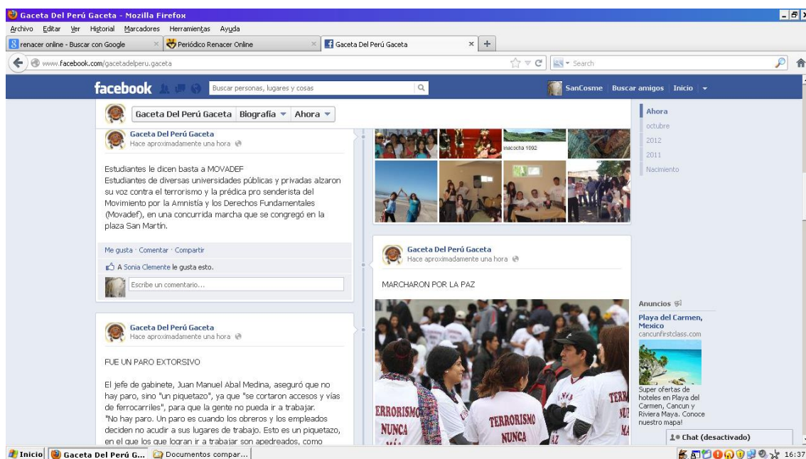
Figura 2: Extracto del muro de Facebook de Gaceta del Perú noviembre de 2012.