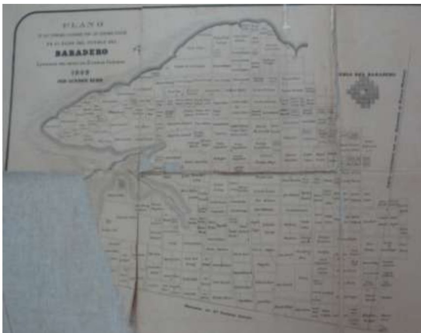
Plano de Baradero y su ejido – 1868- Agrimensor German Kuhr.