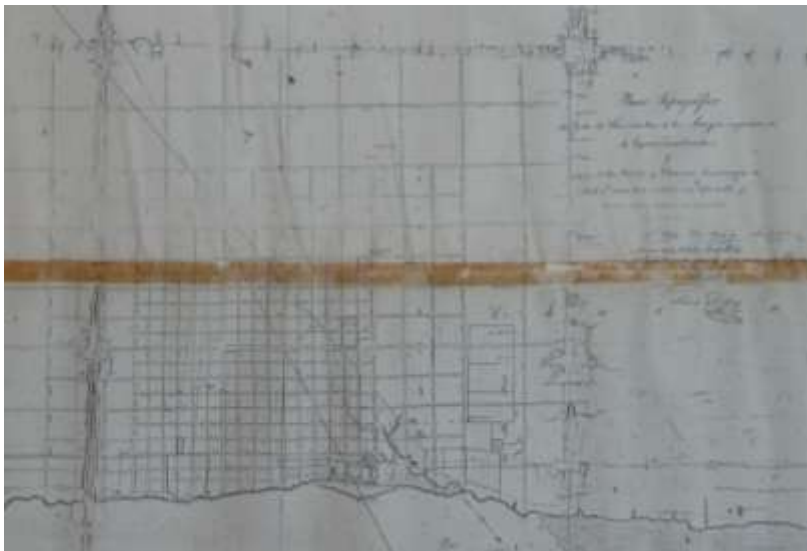
Traza de Pueblo y ejido de Baradero, 1854.

Paralelamente, desde el Superior Gobierno se ordenó al Departamento Topográfico enviara un agrimensor para delinear la traza. Es así como en Diciembre del mismo año, El Ing. St Urbán definió la traza del pueblo y el ejido 48 .