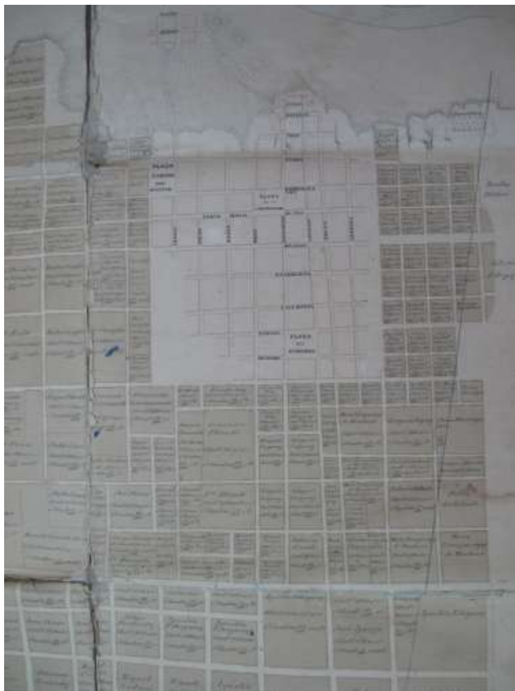
Sector del registro gráfico del pueblo y ejido de Baradero. Germán Kuhr, 1857.

La traza definitiva del pueblo y el ejido, fue realizada por Germán Kuhr en 1868 y 1872, a pedido del Departamento Topográfico 49 .