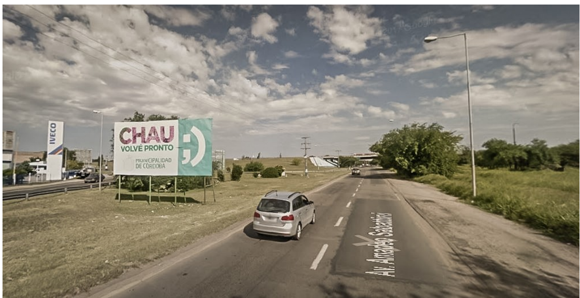
Imagen 2. Chau, volvé pronto.

Para estas última palabras, hay una imagen síntesis de la situación actual que ejemplifica con claridad qué significan los barrios de la periferia para el Estado, nos remite a la vieja discusión sobre el derecho a la ciudad (Lefebvre, 1968; Harvey, 2012), y puede ilustrarse con la siguiente anécdota: la avenida de circunvalación de la ciudad de Córdoba es un límite a partir del cual podría entenderse lo que queda por dentro y lo que queda por fuera de la ciudad. Si bien por fuera se pueden encontrar otras situaciones urbanas, y este límite por sí solo no explica las condiciones del barrio, esta imagen de la circunvalación nos da una idea general de cómo es concebida la ciudad, y lo que está más allá : un enorme cartel de la Municipalidad de Córdoba con la frase “Chau, volvé pronto”, nos despide de la ciudad, seis kilómetros después llegamos a Ituzaingó Anexo, casi la misma distancia que hay desde ese cartel al centro de la ciudad. Los/as habitantes del barrio son saludados -y vueltos a recibir- a diario por este cartel cada vez que cruzan la circunvalación, claro, el saludo no es para ellos/as, es para los/as turistas, pero eso ya es otro tema. (Imagen 2)