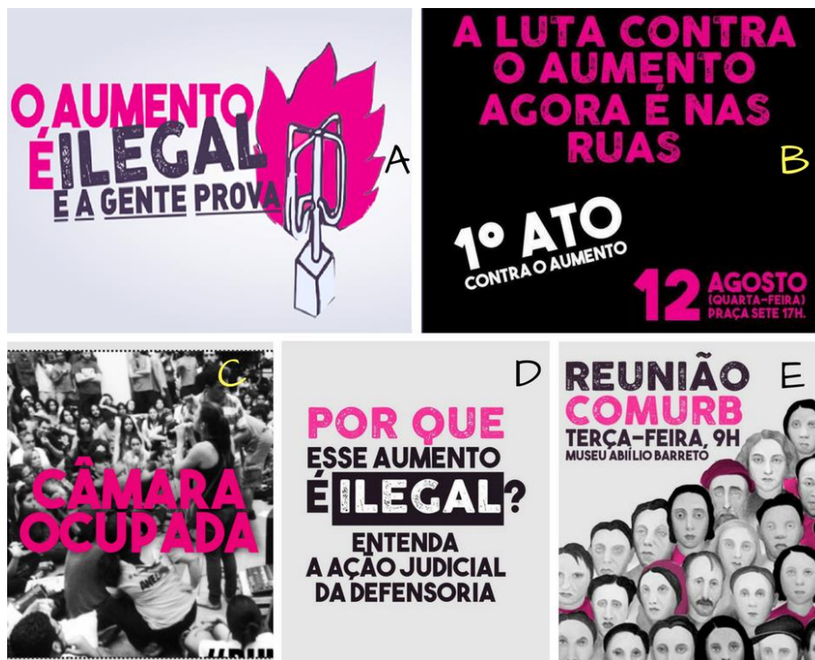
Figura 10: O aumento é ilegal e a gente prova (19/junho de 2015 a 10/março de 2016)