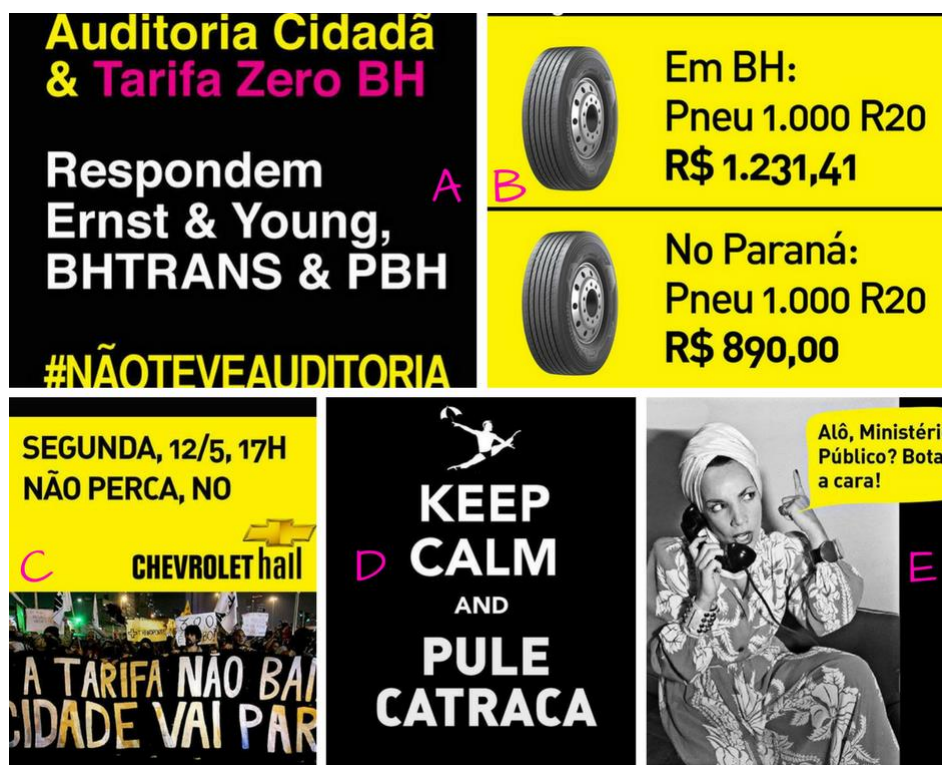
Figura 02: #NãoTeveAuditoria e Se a tarifa aumentar a cidade vai parar (17/março a 21/maio de 2014)