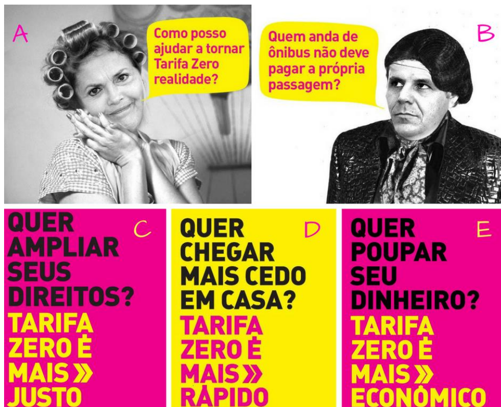
Figura 01: Tarifa Zero é Mais (09/setembro a 18/outubro 2013)