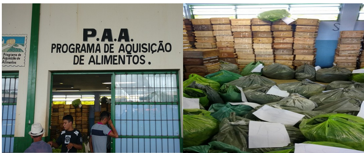
Figura 04: Entrega de produtos ao PAA na Ceanorte de Montes Claros.

Os mercados abriram, continuou os mesmos e outros, valorizou os mesmos, esses mercados que nos já tinha, o pessoal já preocupou. Eles falou: opa, pera aí, eles já tem outros compradores, esses pessoal já procurou outro mercado que é o PAA, eles já tem outra saída, que eles já não ta tao preso a nós, porque eles não são bobos, depois do PAA, eles falou: perai, eu tenho de ter um jogo de cintura para comprar desses agricultores agora. Os mercados novos que abriram que eu vejo, teve, mas o importante que valorizou os que nós já tinha e melhorou os preços dos produtos. O PAA tira o excesso, a palavra certa é essa. A gente não tinha segurança, o cara chegava e oferecia você tinha de vender (Morador E, 2017).