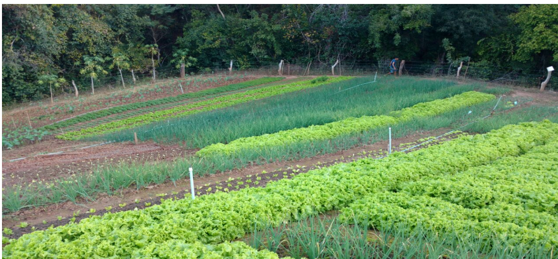
Figura 02 - Horta diversificada de agricultor familiar pertencente à ASPROHPEN