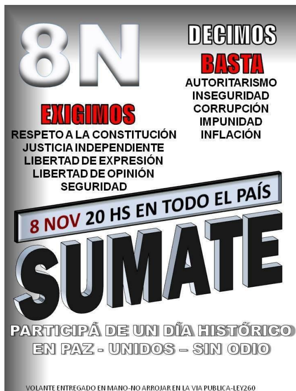
Imagen 1 - El Anti-K, 2/11/2012

Como puede verse en el volante publicado por el grupo, para impresión y difusión del evento en distintas ciudades del país, las pautas principales de la movilización son el “respeto a la Constitución Nacional”, la “justicia independiente”, “libertad de expresión”, “inflación” y “seguridad”. Paralelamente, dichos marcos interpretativos ya están presentes, en alguna forma, en las editoriales y columnas (fueron contabilizadas las columnas “del día”), aparecidas con anterioridad a la publicación del mismo, los días 11, 13, 15, 17, 18, 20, 21, 22, 26, 28, 29 y 30 de octubre y 2 de noviembre.