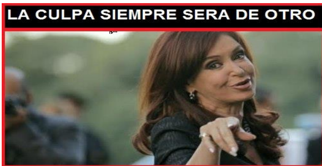
Imagen 2 - El Cipayo, 10/10/2012

El texto que acompañó a la imagen 2 en la publicación de facebook indica