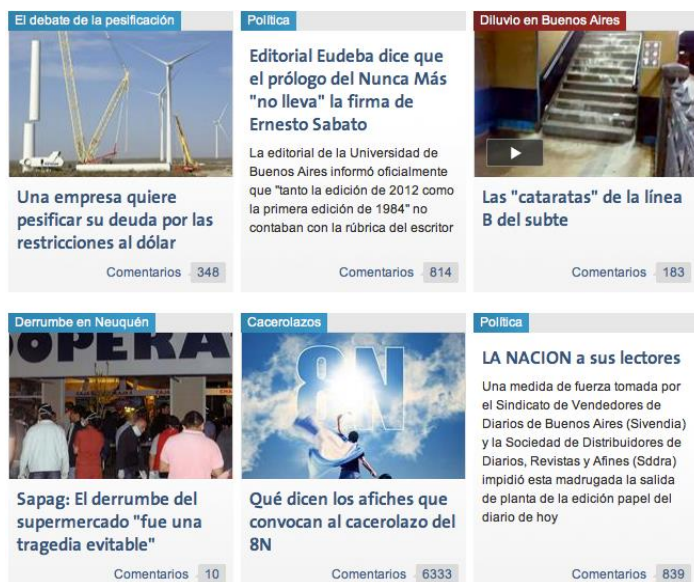
Imagen 6 - La Nación (online), en El Cipayo, 29/10/2012

Finalmente la imagen 6 es una captura de la versión online del diario La Nación, publicada por el grupo El Cipayo, durante la organización del cacerolazo. Allí se ve como ambos actores se benefician recíprocamente, por un lado el diario se permite difundir la convocatoria, mientras los grupos valorizan la propia actividad por haber sido publicada en los canales tradicionales. En esta dirección apuntan las declaraciones tanto de YS cuanto de LB