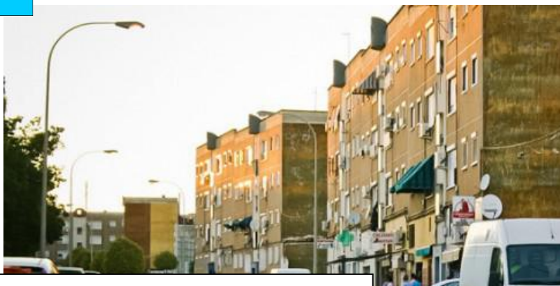
Figuras 1-3. Localización de la barriada en el contexto español.

En este contexto, buena parte del alumnado que cursa ESO desarrolla una convivencia diaria entre problemáticas sociales y personales de importancia, lo cual repercute de manera negativa tanto en su rendimiento académico (presenta un elevado desfase curricular así como de absentismo en clase), como personal (violencia, ausencia de conductas empáticas, escasa asertividad). Para paliar los manifiestos déficits que presentan, se ha diseñado un proyecto de intervención global en la barriada, pretendiéndose la mejora en varios ámbitos. Concretamente, para el caso del IES, esta intervención se centra en siete pilares: