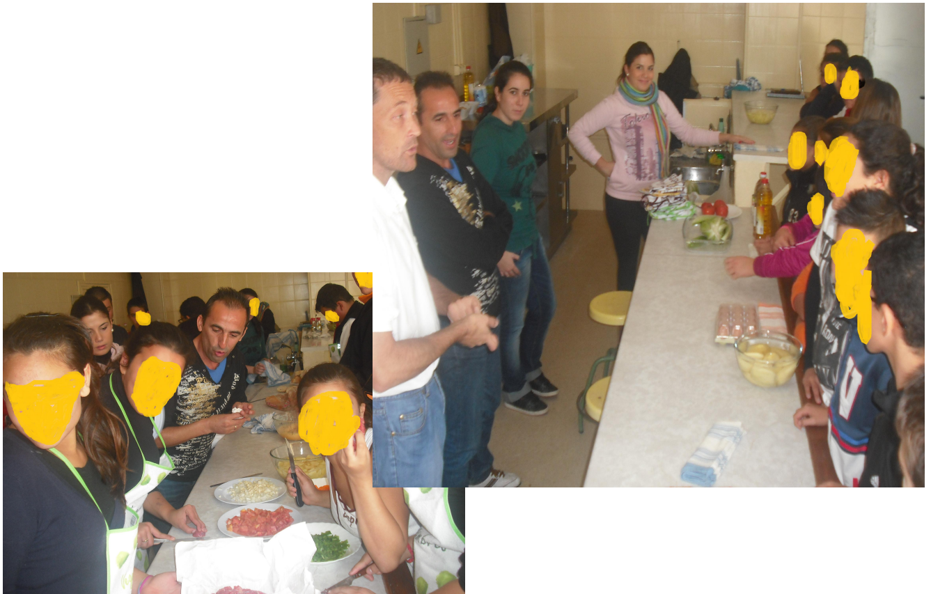
Figuras 5 y 6. Imágenes de los talleres de cocina donde, gracias a la participación ciudadana y de asociaciones, se está introduciendo al alumnado en los principios de la coeducación, el trabajo cooperativo y la apreciación de diferentes culturas por medio de elementos comunes como es el “mundo del sabor”.

tiempo que alumnos con discapacidades auditivas, sensoriales o psíquicas, todos ellos trabajando al unísono con la participación de familias y voluntarios de la zona