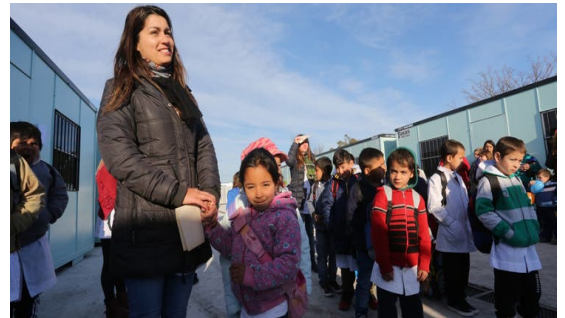
Imagen 18 Primer día de clases