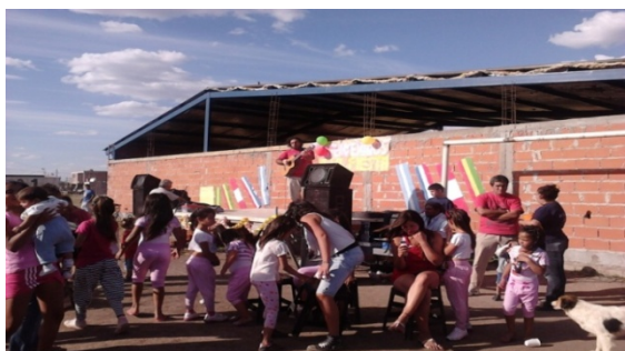
Imagen 11 Festejo compartido del primer año en el Barrio Archivo Fotográfico Madre Tierra

Estos proyectos entrelazaron el aspecto socio participativo con la propia historia, crearon nuevos escenarios de acción reales y sostenidos desde el mismo proceso organizativo, pusieron en juego escenarios de poder, hicieron visibles los actores reales y sus relaciones (incluidos los actores gubernamentales, políticos y técnicos), (Catenazzi, 2011).