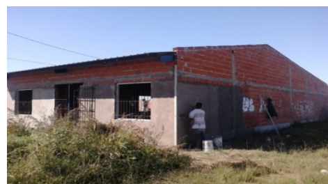
Imagen 10 Centro Comunitario La Pachamama en obra Archivo Fotográfico Madre Tierra