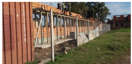
Imagen 20 Unidad Sanitaria (en obra)