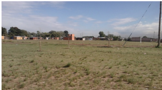
Imagen 7 Predio reservado para equipamiento Archivo Fotográfico Madre Tierra