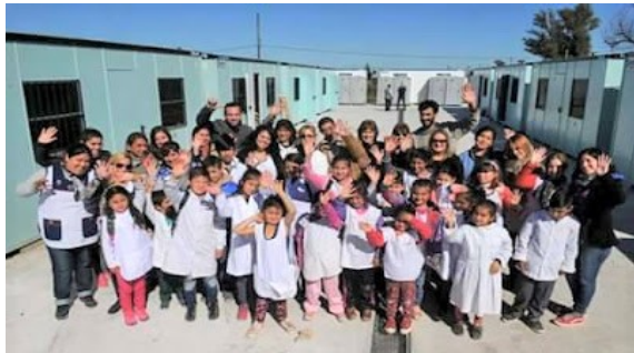
Imagen 17 Escuela Primaria N°84 (Modular)

La Escuela Primaria N° 84 del Barrio Los Hornos, de Cuartel V resultó de la gestión comunitaria emprendida por las organizaciones. Fue un primer paso para resolver la emergencia instalar 12 aulas modulares en espera de la construcción de la Escuela definitiva.