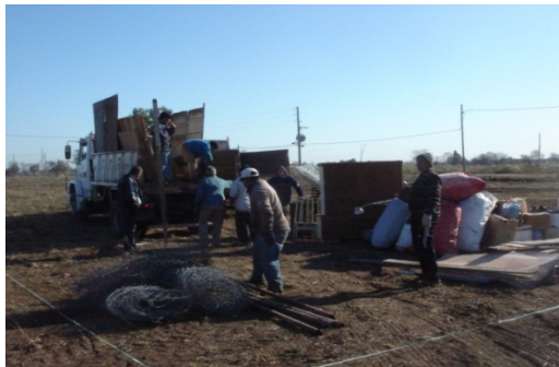
Imagen 1 Mudanza y ubicación en el terreno

Cada familia asumió la responsabilidad del armado de su vivienda provisoria respetando los acuerdos previos para su ubicación dentro del lote, previendo el espacio necesario para su construcción definitiva futura.