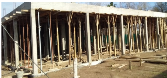
Imagen 19 Escuela Primaria N°84 (en obra)