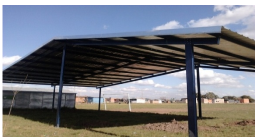
Imagen 9 Al fondo: Centro Comunitario Provisorio

Varias líneas de acción algunas en simultáneo y otras en serie, se desarrollaron desde un abordaje integral, campañas de documentación, programas de vacunación, provisión de materiales para inicio de vivienda definitiva, adjudicación de medidores individuales de servicio eléctrico, construcción de veredas por cooperativa, arbolado, proyecto y búsqueda de recursos para la realización de un centro comunitario, provisión de un obrador que sirvió de biblioteca provisoria, espacio de reunión comunitaria, apoyo escolar y otros tantos programas implementados durante el primer año.