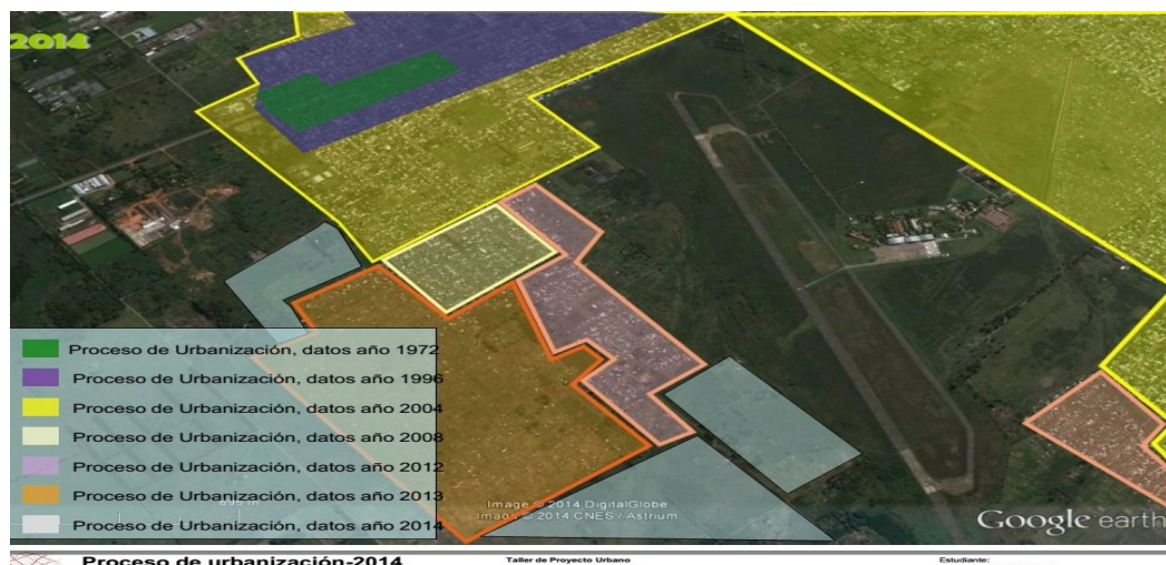
Imagen 13 Mapa elaborado por estudiantes de la carrera de Urbanismo de la UNGS

Con el tiempo nuevas ocupaciones se produjeron en derredor, originando nuevos desafíos para la zona, se hizo necesario organizarse para enfrentarlos comunitaria y solidariamente.