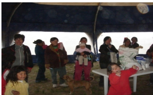
Imagen 3 Mudanza. Recibimiento de los vecinos

Recibieron comunitariamente a los nuevos pobladores en una carpa con un servicio de comida caliente, colchones, frazadas y baños químicos provistos por el Municipio.