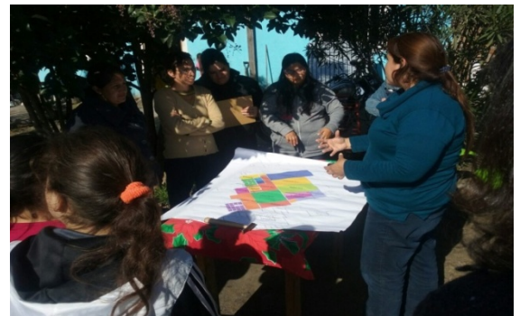
Imagen 22 Mesa de Tierra y Hábitat – Cartografía.

Desde el consejo de Organizaciones se abordan las problemáticas de salud, educación, transporte, urbanización, diseñando estrategias comunes y apoyando iniciativas de los colectivos que la componen, organizando demandas logrando hacer visibles necesidades y proponiendo líneas de acción conjunta con el Estado Local.