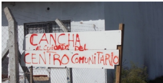
Imagen 5 Cuidado de los predios reservados

Este proyecto urbanístico que se construyó y asumió por la comunidad, resultó en acuerdos de uso y cuidado durante años. Las vecinas y vecinos protegieron estas tierras reservadas de todo intento de ocupación con mecanismos de control comunitario.