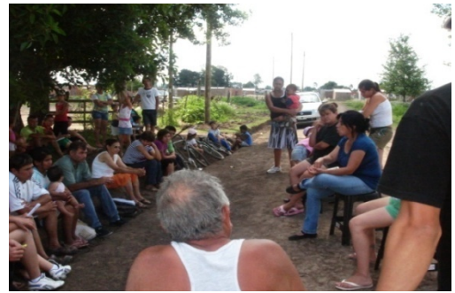
Imagen 2 Primer Reunión organizativa por manzana

La territorialidad es en esencia un fenómeno social (Demmatteis, 2000), esta afirmación atraviesa la realidad de los sectores populares, ante la mudanza los barrios vecinos prepararon una bienvenida previendo que las familias pasarían los primeros días en situación de mucha vulnerabilidad.