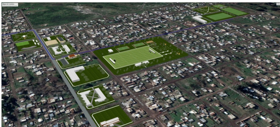
Imagen 25 Proyecto Urbanístico con “Propuesta de Equipamiento Futuro” conformando una Nueva Centralidad en Los Hornos

Se abre un nuevo imaginario a futuro para la zona.