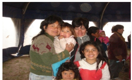
Imagen 4 Mudanza. Recibimiento de los vecinos

La territorialidad examina los individuos singulares, pero en cuanto componentes de grupos, en la medida en que las relaciones de proximidad física siguen manteniendo un papel esencial y expresan formas de territorialidad distintas, según las relaciones que sus propios sujetos establecen con el territorio entendido como un conjunto de condiciones-vínculos-recursos potenciales ligados a la naturaleza de los lugares (Demmatteis, 2000)