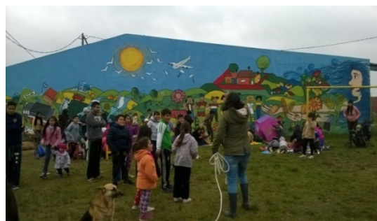
Imagen 12 Centro Comunitario La Pachamama años después

Estos grupos compuestos en un 100% por mujeres de varias nacionalidades: peruanas, paraguayas y argentinas, cuyas edades oscilan entre 27 y 50 años, con tres o más hijos menores a cargo y estudios primarios completos sostuvieron lo organizativo y llevaron adelante objetivos comunes.