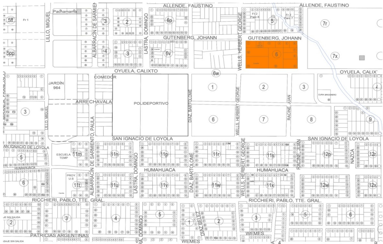
Imagen 14 Plano de la zona basado en la Cartografía realizada por el equipo técnico del Iduar y los propios habitantes de los barrios

Ante una situación que genera preocupación comienza a generarse conocimiento acerca de ella. Hay conocimientos que se elaboran y reproducen en ámbitos científicos, técnicos-profesionales, y hay otros que parten de la población que se percibe afectada. El conocimiento es principalmente construido por quienes tienen necesidad de amortiguar los impactos negativos de una situación amenazante. Conocimiento que se produce a través de la experiencia vivida, de la memoria colectiva y de la resignificación de los saberes científico-técnicos disponibles (...) (p.164)