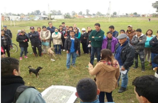
Imagen 21 Mesa de Tierra y Hábitat – Cartografía

La Mesa Barrial de Tierra y Hábitat integra a vecinas de Los Hornos y de nuevos asentamientos junto a un equipo del Instituto de Desarrollo Urbano y Ambiental Regional del Municipio de Moreno (IDUAR), la misma conforma un espacio de organización más amplio donde se toman decisiones que hacen a la zona.