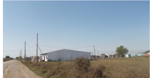
Imagen 6 Cancha vecina al Centro Comunitario