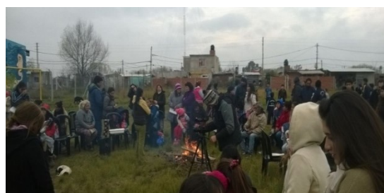
Imagen 16 Asamblea torno a la falta de escuela

Uno de las emergentes más acuciantes, fue la cantidad de niñas, niños y adolescentes sin escolaridad y la imposibilidad de acceder al derecho a la educación, de carácter obligatoria según la Ley Nacional de Educación Ley 26.206 sancionada en 2006. Más de 500 niñas y niños sin vacantes hicieron que las madres y padres junto a las organizaciones realizaran asambleas para encontrar modos de ser escuchados. Se intentaron varios caminos y se realizaron gestiones infructuosas, por lo que se decide presentar un amparo judicial a través de la organización El Arca, dado su trabajo