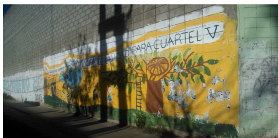
Imagen 15 Mural Barrial pidiendo llegue la Escuela

Las demandas emergentes y las situaciones conflictivas fueron creciendo en su complejidad y en sus efectos en el territorio, las problemáticas debían ser afrontadas en forma más amplia, fue así que las organizaciones sociales y barriales de la zona se autoconvocaron para compartir la realidad, analizar en conjunto el contexto, actores y escenarios posibles, estrategias de alianzas y resistencia. Desde las especificidades cada organización según su visión y experiencia, aportó en la construcción de un diagnóstico tanto de la zona como de contexto socio político en sus distintos niveles. Esta forma de pensar y acompañarse, fue dando forma a un nuevo nacimiento: un colectivo de colectivos. Renació la idea de conformar un consejo de organizaciones desde donde ejercer poder en pos de derechos y realizar acciones conjuntas en el marco de acuerdos mutuos que como afirma Demmateis, resultan ser un conjunto de “anclajes”, “palancas”, medios para su concreción, en un proceso coevolutivo complejo, en cuyo centro se sitúan las redes locales de sujetos que hacen de interfaz entre las relaciones con el resto del mundo y aquellas propias de lo local y, a través de este, con el resto del sistema de redes.