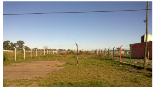
Imagen 8 Predio reservado para equipamiento