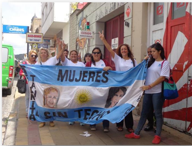
Figura 2: Visibilizando el reclamo de acceso en calles de la ciudad