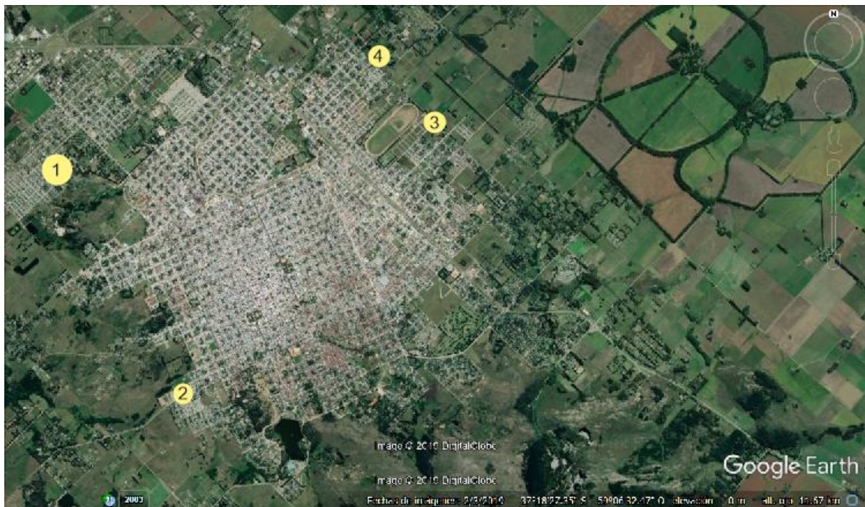
Mapa 12. Ubicación de los emprendimientos de MST.