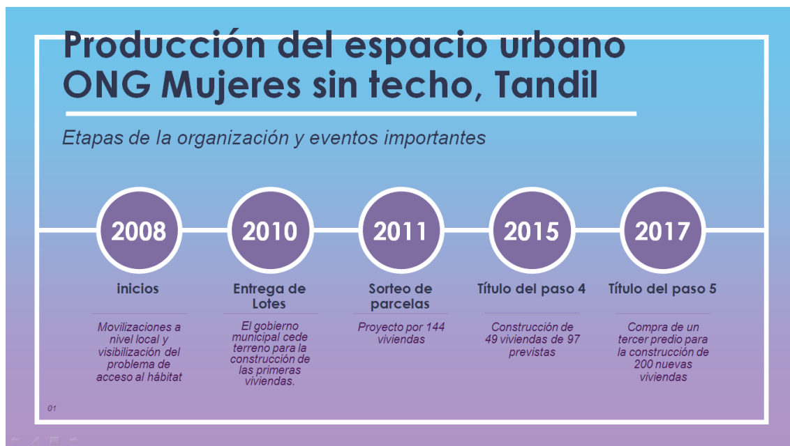
Figura 3. Línea temporal de la producción de espacio urbano de mujeres sin Techo

En 2011, usando la experiencia acumulada y valiéndose de ser reconocidas como un ejemplo de organización social, constancia y conciliación con el gobierno local, emprendieron otros dos proyectos con la compra para urbanización de dos predios y la construcción de un total de otras 144 viviendas.