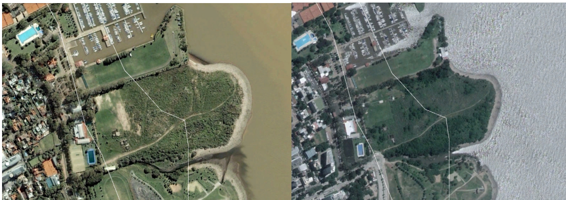
Izquierda: año 2008; derecha: año 2018

En la página de Facebook de la Asamblea Todxs por el Yrigoyen, la organización vecinal