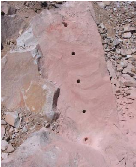
Perforaciones hechas para vertido del cemento expansivo.

Con el apoyo del gobierno, algunos lajeros han comenzado a utilizar el cemento expansivo, un material cuyo fraguado expande su volumen produciendo el agrietamiento en línea recta siguiendo la línea de las perforaciones sin producir dispersión de partículas, gases ni polvos. El uso de cemento expansivo para agilizar y obtener bloques de laja sin lastimar la estructura de la roca aumenta el rendimiento y la calidad de la producción. Esta técnica no necesita permiso de utilización de ninguna autoridad, ni riesgos de accidentes en el manipuleo de los productos, siendo de fácil implementación y bajo costo. A medida que se utilizan técnicas más modernas se obtienen bloques de material más uniformes con lo que el aprovechamiento de material es muy alto y descende la generación de estériles, además se adapta mejor al resto del proceso productivo y a los pedidos del mercado.