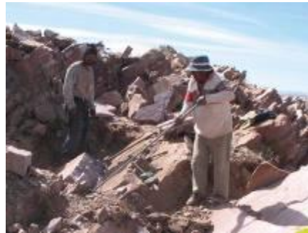
Extracción a barreta en frente de canteras