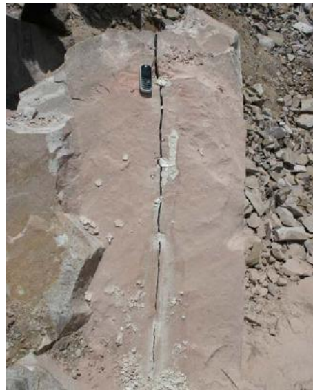
Rotura sobre línea de corte, tras 24 hs del cemento expansivo en las perforaciones de la piedra.