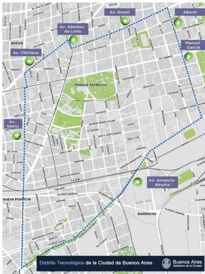
Figura N°1: El Distrito Tecnológico