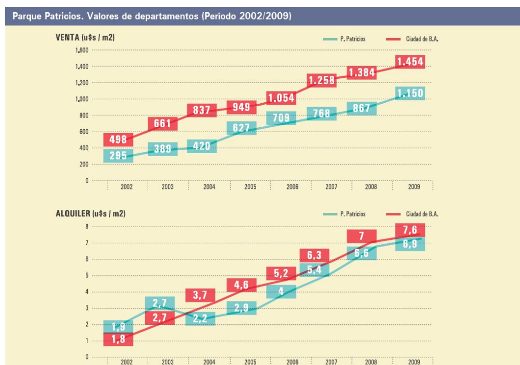
Cuadro N°2: Valores de departamentos, en Parque Patricios, 2002-2009

Fuente: L.J.Ramos Brokers Inmobiliarios en base a CIISOM sobre datos de oferta publicada en los principales medios gráficos.