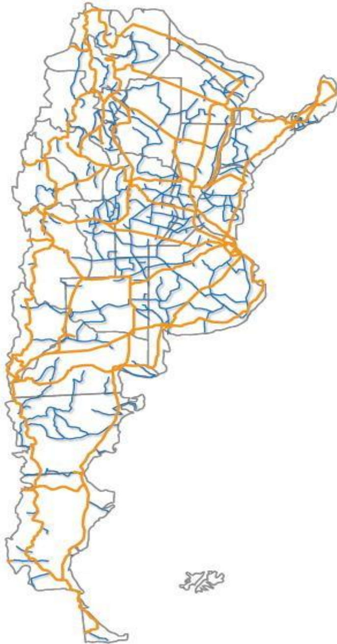
Figura 3.- Red Federal de Fibra Óptica 2015 (Proyecto Integral)