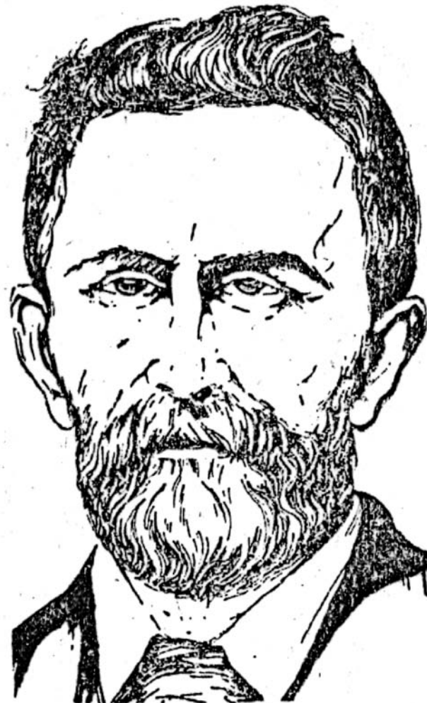
R.G. 3. Retrato de Errico Malatesta (1853-1932) La Antorcha . Buenos Aires, 10.07.1929. Año IX. N° 292, p. 3.

Somos vencidos. Pero no tenemos el ánimo de los vencidos. Férvida está siempre la fe en nosotros, fuerte la voluntad, segura la esperanza del ineluctable desquite. Esta nuestra derrota es una de aquellas que siempre, de trecho en trecho, han detenido a los luchadores por la elevación humana sobre la fatigosa vía del progreso. No es más que un episodio de una larga guerra.— Errico Malatesta.