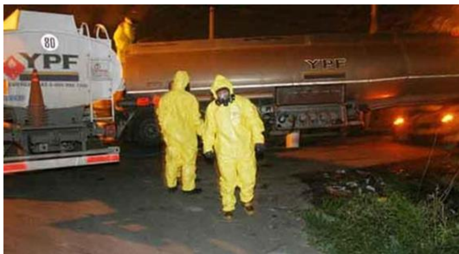
Figura nº 4. Accidente con transporte de metanol. La Plata.