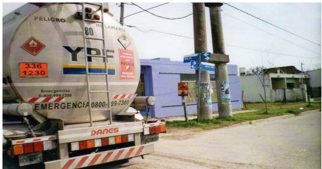
Figura nº 2: Siniestros en la provincia del Neuquén

Fuente: Juliarena y Moretti, abril 2008. Brandsen