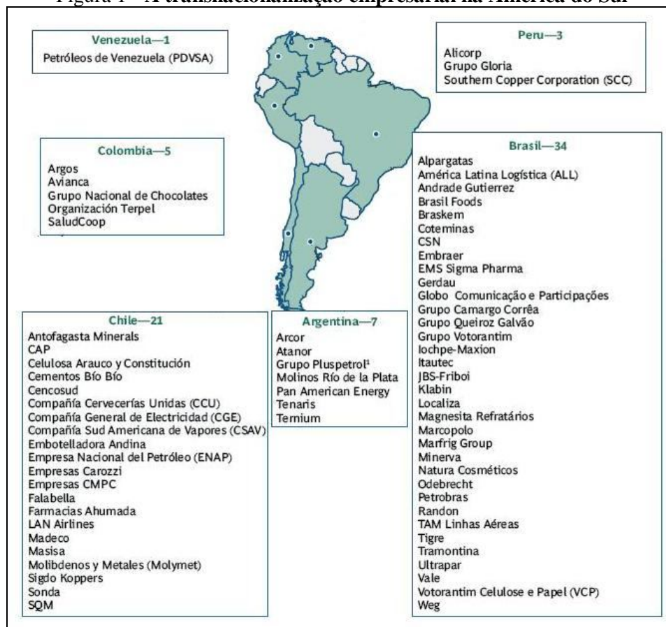
Figura 1 - A transnacionalização empresarial na América do Sul