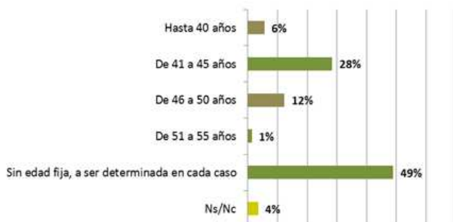
Gráfico 11: ¿Hasta que edad la MUJER debería someterse a las TRHA?

Fuente: Elaboración propia en base al relevamiento realizado. Base: 219 casos