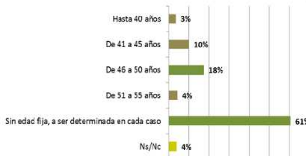
Gráfico 12: ¿Hasta que edad el HOMBRE debería someterse a las TRHA?

Base: 219 casos