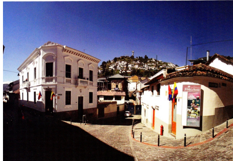
Recorte de revista institucional sobre el proyecto del Barrio La Ronda, post recualificación.

Este barrio emblemático de Quito ha dejado atrás un pasado de marginación que lo había condenado a un marasmo de décadas, para probar que la protección del patrimonio y el desarrollo social pueden ir de la mano.