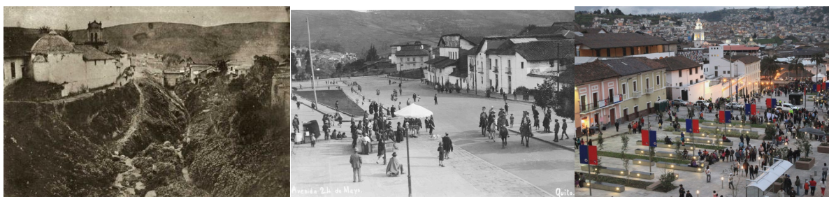
Izq.: Quebrada de los Gallinazos, rellenada para dar lugar, a inicios del siglo XX al Boulevard 24 de Mayo. Fuente: Archivo Museo de la Ciudad, Quito. Centro: Boulevard 24 de Mayo a inicios del siglo XX. Fuente: Archivo Museo de la Ciudad, Quito. Der.: Boulevard 24 de Mayo en la actualidad. Fuente: Diario el Comercio. Quito Patrimonio Digital. En: www.patrimonio.elcomercio.com

Las representaciones aparecen asociadas al patrimonio a través de relatos que apelan al mismo tiempo a la nostalgia del lugar, a los personajes y hechos de la historia local y nacional, al valor arquitectónico y simbólico que está en riesgo y hay que recuperar. Kingman (2014) plantea el doble carácter ideológico del patrimonio tanto como espectáculo como “lugar de glorificación del pasado” (140). Relatos que también se intensifican a medida que se aproximan intervenciones concretas y adquieren el valor de una proeza al incorporarse en los relatos del “antes” y “después” de los lugares recuperados.