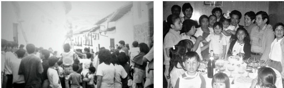
Vida barrial en el Barrio La Ronda, CHQ, años ochenta.

En términos sociales, el efecto parece no ser tan auspicioso. Estudiadas desde la perspectiva de la segregación socio-espacial o desde los estudios sobre regeneración/ gentrificación/recualificación 4 , vemos cómo ciertas intervenciones urbanas - que toman como bandera los discursos del patrimonio, la cultura, la naturaleza y el espacio público - tienen el efecto de ocultar un progresivo abandono de políticas sociales (Lacarrieu 2010, 2014), en lugares que son habitados mayoritariamente por sectores medios y populares y amplias poblaciones con necesidades básicas insatisfechas.