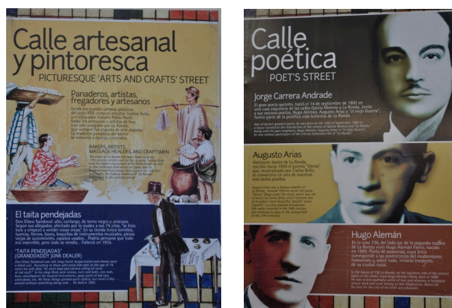
Carteles interpretativos sobre el espíritu artesanal, pintoresco y poético del lugar. Calle Morales, Barrio La Ronda, CHQ.

Si bien los procesos de recuperación de memoria son prácticas muy instituidas en la gestión cultural en centros históricos, estos han aparecido por lo general asociados a la producción de relatos anecdóticos en los que la problematización o el conflicto está ausente y en los que son comunes las prácticas de demarcación de lugares y casas por vía de la instalación de imágenes, dispositivos de interpretación, textos, etc.