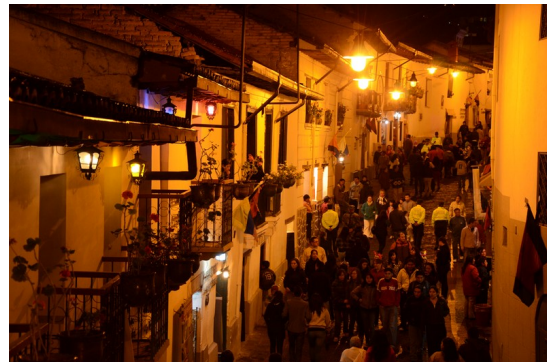
Izq.: Seguridad durante el día. Barrio La Ronda, CHQ. Der.: Visitantes durante la noche. Barrio La Ronda, CHQ.