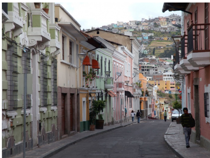
Calle Junín en San Marcos.