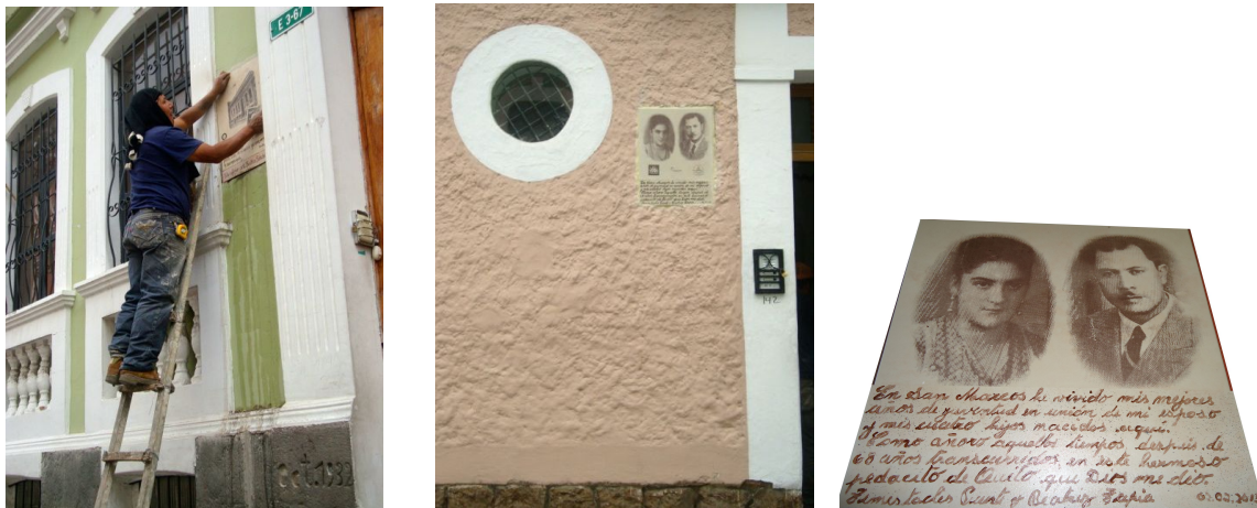
Fachadas intervenidas en el Paseo de la Memoria Barrial.

Si una primera lectura habla del uso del código musealizado del patrimonio, una mirada más detenida entiende que se trata de puntos de fuga, pues estas irrumpen en el espacio público desde los mundos privados e íntimos de los habitantes, desde el álbum familiar antes que desde el archivo histórico, desde el recuerdo y el afecto antes de la prueba histórica. La fotografía junto al relato narrado en primera persona y escrito con una grafía imperfecta adquiere no solo valor anecdótico sino de presencia de los sujetos en un contexto de disputas por el lugar.