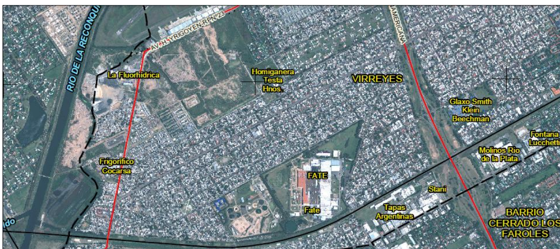
Figura 3: Ubicación de plantas fabriles en torno de la autopista Acceso Norte