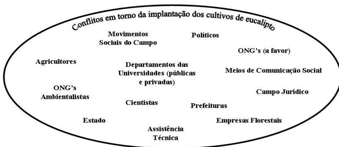
FIGURA 2. Arena pública em torno do conflito ambiental gerado a partir da implantação de novos cultivos de eucalipto no RS.

E quem são os atores deste conflito? Na arena pública de conflito que se configurou no RS, é possível identificar diversos atores sociais mobilizados, como pode ser visualizado na figura abaixo.