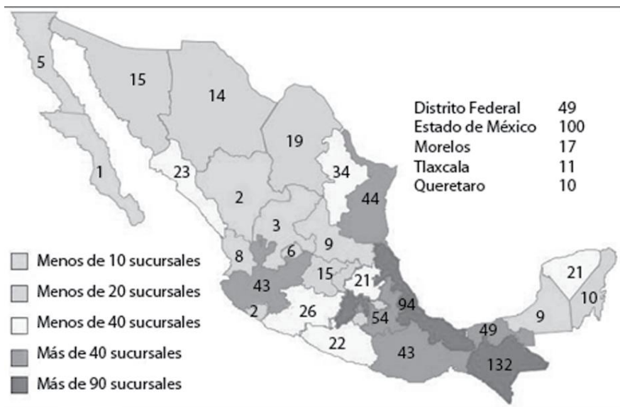
Mapa 1. Cobertura territorial por estado de las instituciones microfinancieras en México, 2007