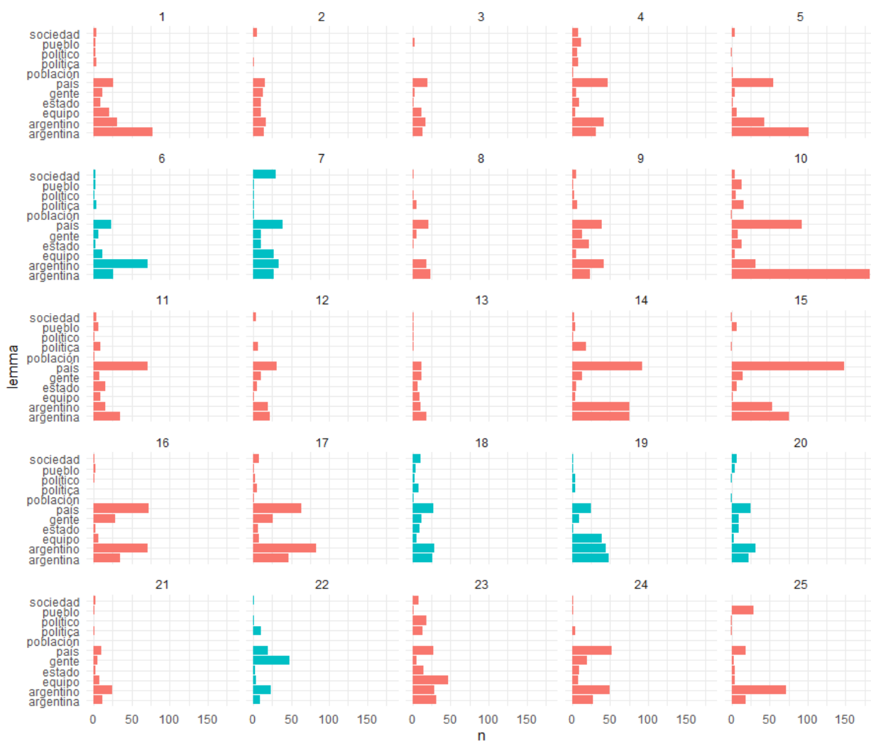
Gráfico 2. Incidencia de ciertas palabras en oraciones representativas de cada tópico

En lo que sigue de esta sección nos referimos a cada tópico, describiendo el campo de oraciones que hemos relevado a partir del muestreo realizado, y vinculándolo con las interpretaciones de Ciardiello (2018, 2019, 2021) sobre el discurso de Macri.